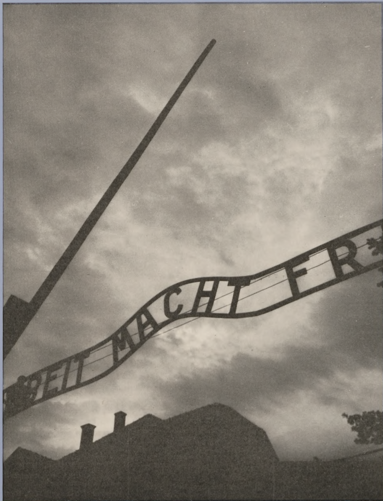
Den polske billedudstilling på Frihedsmuseet er høj fotografisk kunst. Adam Kaczkawski har her indfanget den dystre stemning, der hvilede over indgangen til Auschwitzlejren. Trods det forjættende løfte om, at arbejde giver frihed, måtte flere millioner fanger ofre livet her.