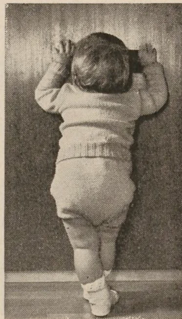
Hvad bringer det nye år?