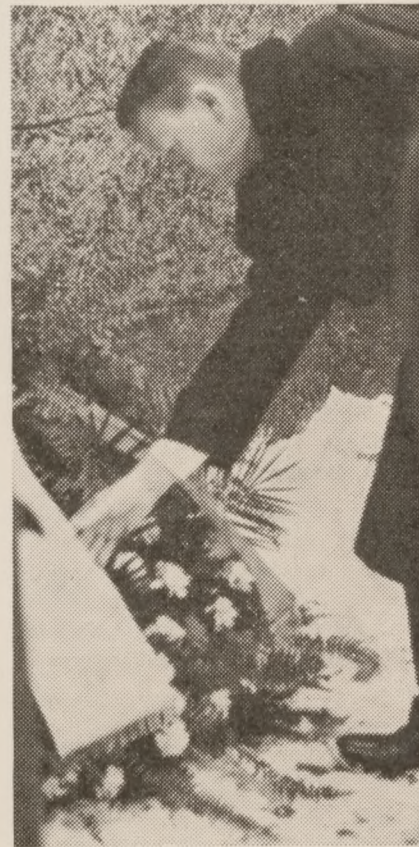
Statsminister Krag nedlægger blomster i Auschwitz.