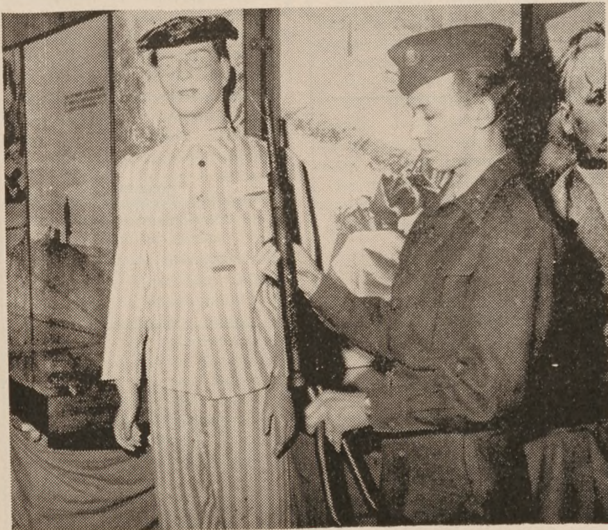
En hjemmelavet Stengun vises frem af en af hjemmeforsvarets folkene. I baggrunden voksmannequinen i fangedragt.

Udstillingen viste yderligere en omfattende fotomontage om forholdene i en kz-lejr, samt en voksmannequin iført kz-lejrens fangedragt. Det var ikke mindst alt dette, som især interesserede de unge, der mødte frem på udstillingen.