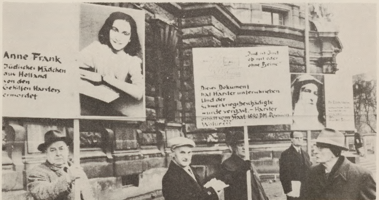
Processen mod Anne Franks mordere har ladet vente længe på sig. Da den indledtes i München, viste civilbefolkningen sin medleven bla. ved at demonstrere med plakater, der tydeligt kræver, at retfærdigheden skal ske fyldest.

I alt 90 menighedsråd havde sagsøgt kirkeministeriet for at få omstødt tilladelsen til flytningen af de tyske grave på de danske kirkegårde. Kirkeministeriet blev imidlertid frikendt.