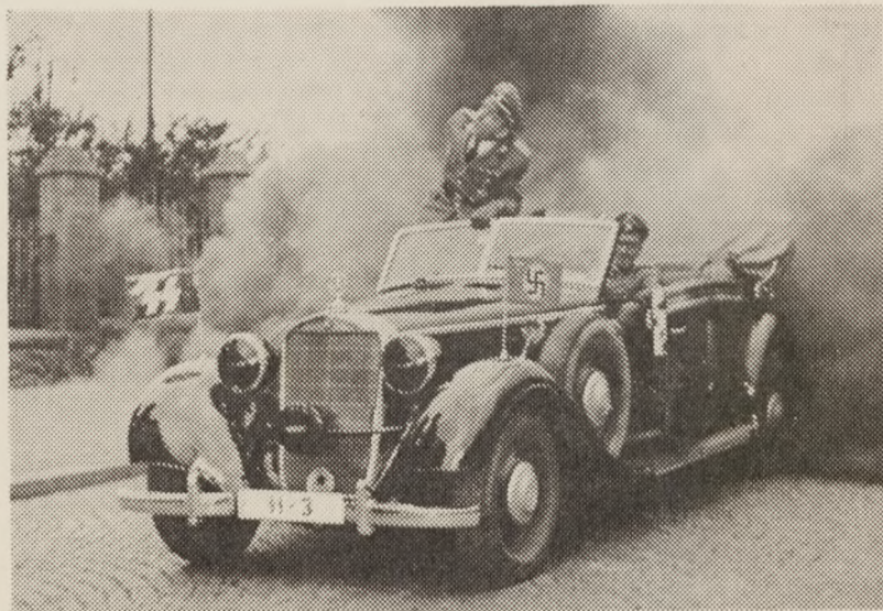
SS-general Reinhard Heydrich, da han såredes dødeligt på en af Prags gader. Tusinder af uskyldige myrdedes under tyskernes hævnaktioner. Byen Lidice udsløttedes.

er raske kammeraters hilsen til de syge.