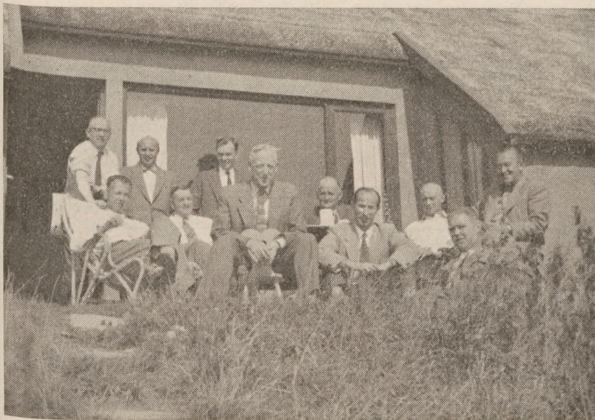
Nogle af 14/10's medlemmer under et årsmøde.

De opholdt sig i den overfyldte Aarhus arrest. Nogle i enecelle, de mere heldige to sammen, alt efter Gestapos uransagelige belastningssystem. De frygtede forhørene i universitetsbygningen, i tankerne gennemgik de atter og atter deres „sag“, men først og sidst meldte spørgsmålet sig, „hvordan vil dette ende?“