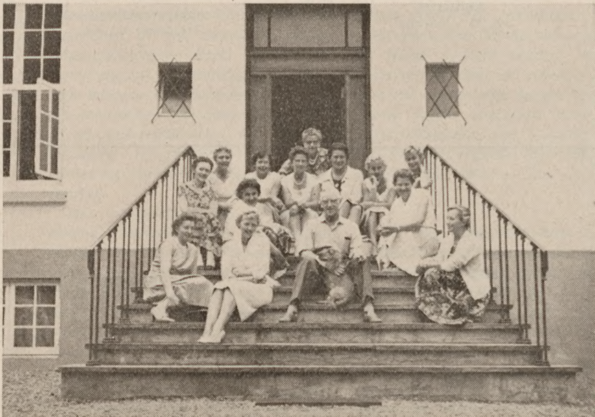
Hvert femte år er damerne med.