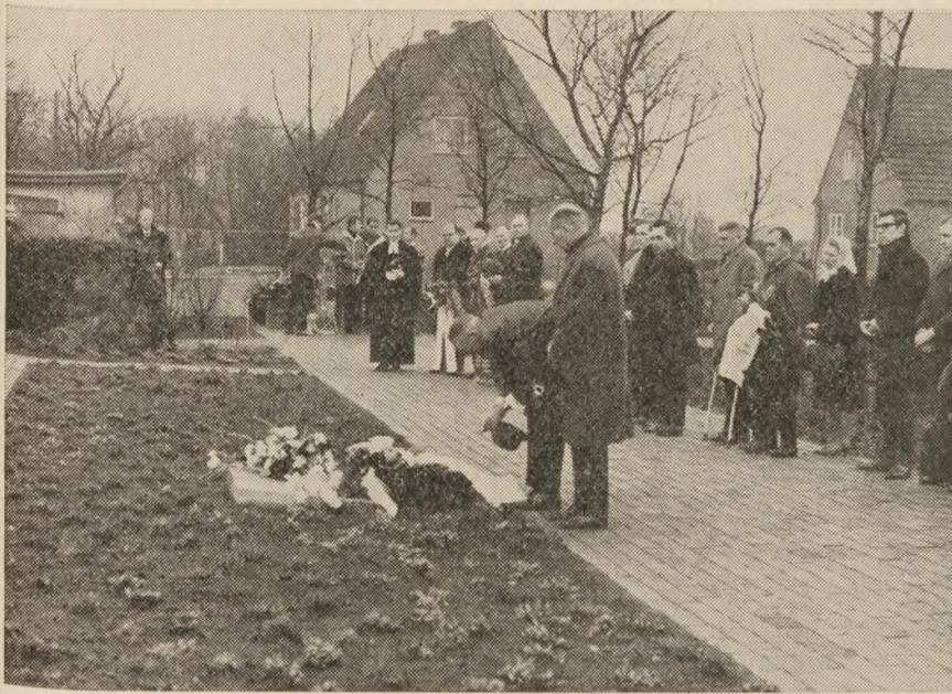
Fra mindehøjtideligheden over ofrene i Ladelund lige syd for den dansk-tyske grænse. — Her er de overlevende fra den lille hollandske by Putten. De nedlægger blomster i den nyanlagte hede-mindepark. Putten er et side-stykke til den franske by Oradour-sur-Glane og den tjekkiske by Lidice.