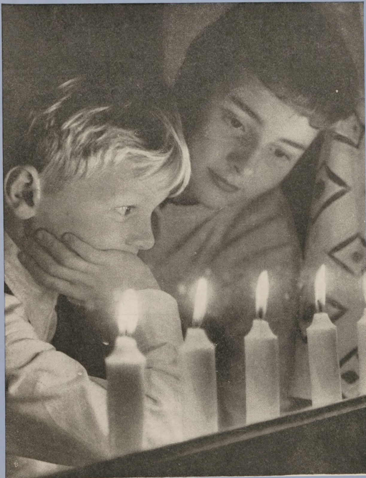
Om nogle få dage tænder vi lysene i vinduerne og mindes 4. maj 1945 — den skønneste dag for vort land i mands minde.