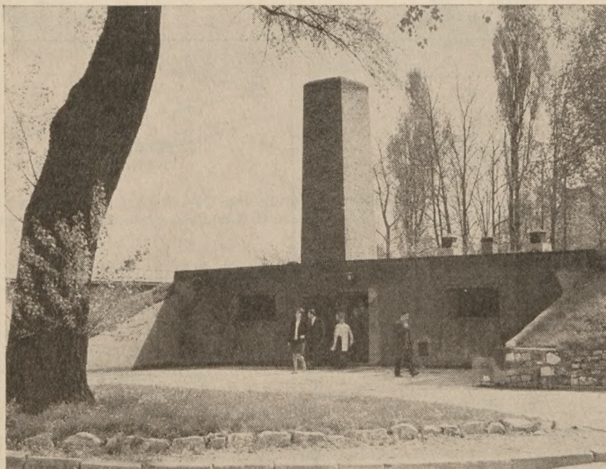
Krematoriet i Auschwitz har omformet 4 millioner mennesker til aske.