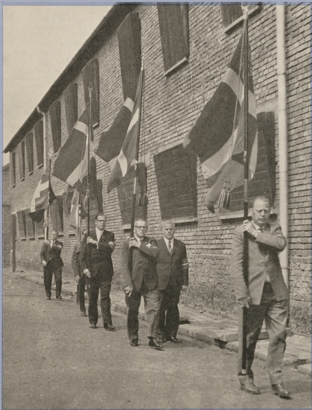
Tidligere kz-fanger og modstandsfolk førte dansk faneborg frem i jordens største udryddelseslejr Auschwitz-Birkenau i det sydlige Polen.