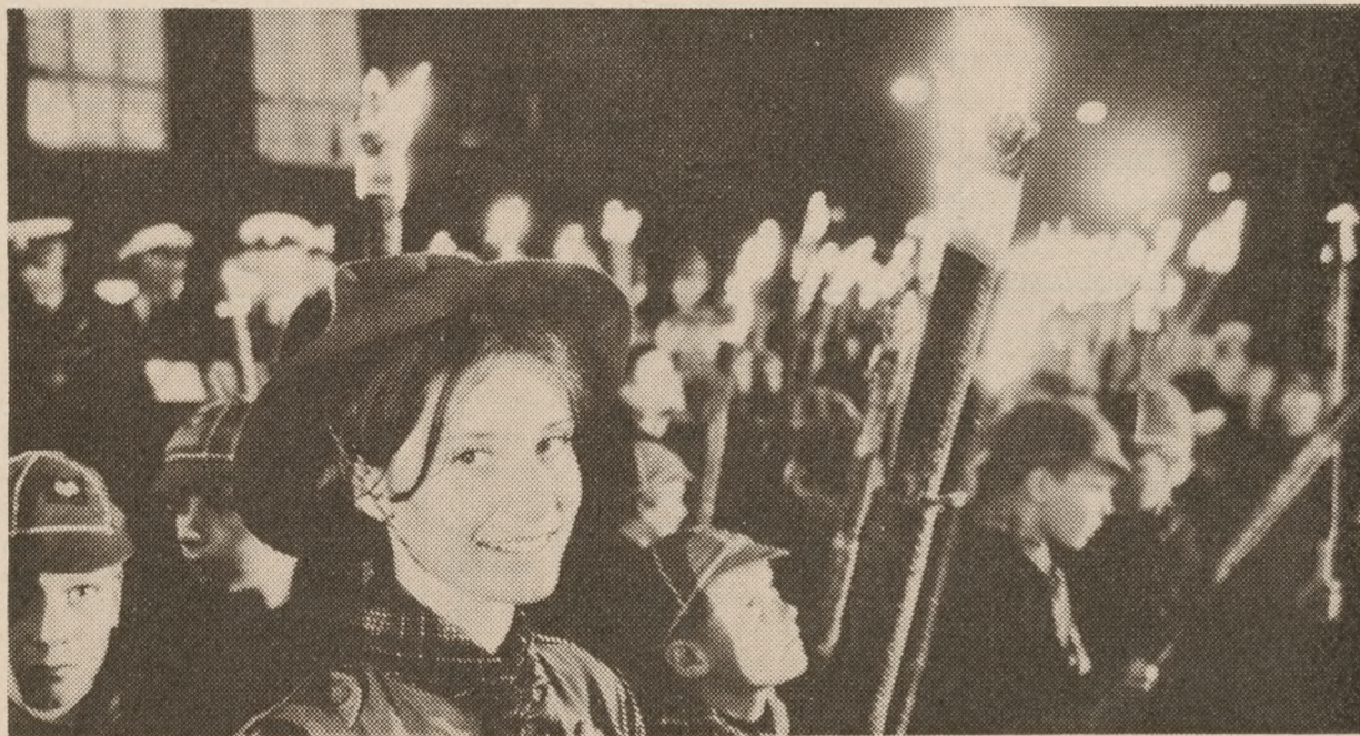
Rådhuspladsen 29. august.

Efter at have omtalt departementschefstyret, „skyggeregeringen“ og Danmarks Frihedsråd understregede ministe-