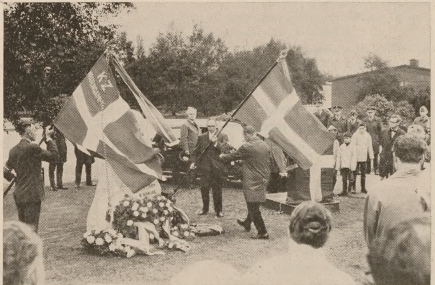
Mindestenen, en grå granitsten, er rejst lige ved tyskernes daværende vagttårn midt i den nuværende CF-lejr. Bogstaverne står i klare messingtyper: „De førtes bort under tvang fra Frøslev-lejren 1944—45 og gav livet for Danmark“.

Den danske herr Sørensen ved særdeles vel, at der er en verden hinsides Skagerak. Men den overlader han til „de andre“ eller til „de store“. Han ved selvfølgelig også særdeles godt, at der er en verden sydpå; thi han har da været på Mallorca og konstateret, at det var da noget værre hundede, man fik at spise der. Men alle de mange spørgsmål, som vedrører den store verden, vil han