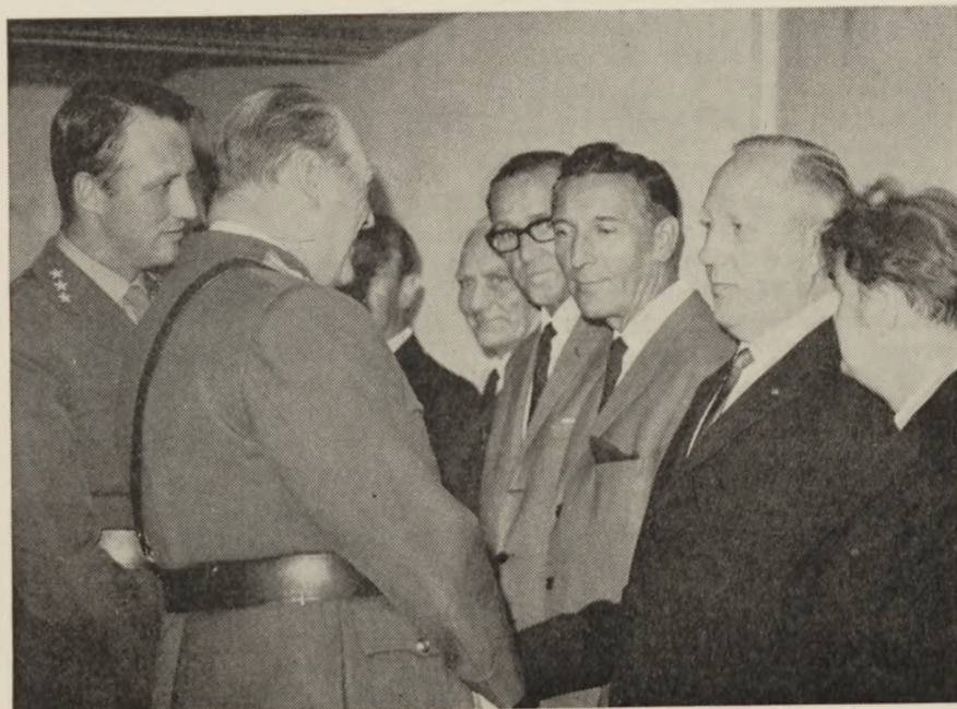
Den norske konge hilste på hver enkelt af de 55 krigsinvalidere på Bæreia.

Desuden er der opført en ny bestyrerbolig.