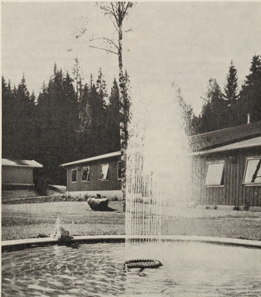
Krigsinvalidehjemmet Bæreia ved Kongsvinger. Parti fra haven ved indgangen.

Kontoret er i Admiral Geddes Gård, Store Kamikestræde 10, forhuset, kælderen. I særlige tilfælde kan tlf. 45 02 60 benyttes, tirsdag og torsdag kl. 10.00–12.00.