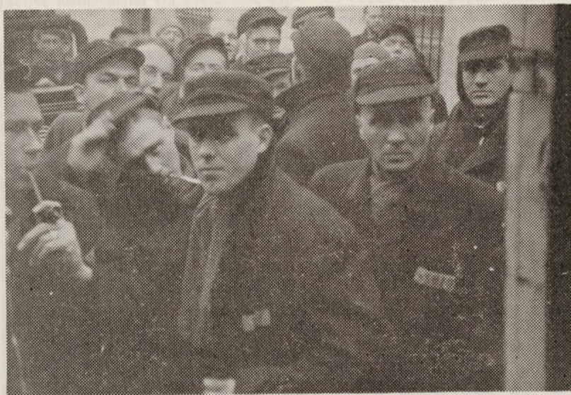
Danske betjente i Buchenwald, fotograferet inde fra en af de danske R. K.-biler. Man ser, at betjentene bl. a. gennem dansk R. K. har fået skihuer.

gang. Han knyttedes til Røde Kors i efteråret 1944.