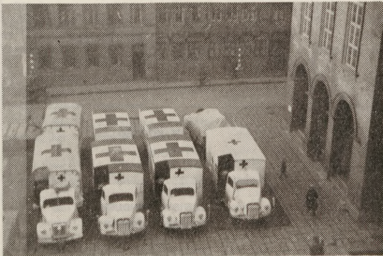
En R. K. konvoj opmarcheret foran rådhuset i Kolding, hvor man altid overnattede.

Oprindeligt havde Røde Kors hverken biler eller mandskab, men klarede sig ved at appellere til en række store danske firmaer og organisationer om ikke bare at hjælpe med penge og varer, men også med lastvognstog og mandskab. F. eks. stillede det nordsjællandske elselskab Nesa, Carlsberg Bryggerierne og en række større vognmandsfirmaer materiel og folk til rådighed. Det samme