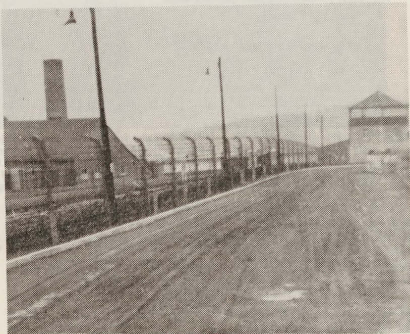
Indkørslen til et kz-lejr-helvede, nemlig til Buchenwald, hvor bl. a. de danske betjente var fanger.