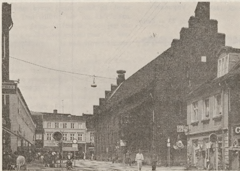
Randers' ældste privathus, Helligaandshuset, hvor der nu bl. a. er turistbureau

Vi måtte så i gang med at skaffe oplyst i en fart, hvilken transformator det ville have størst effekt at sprænge.