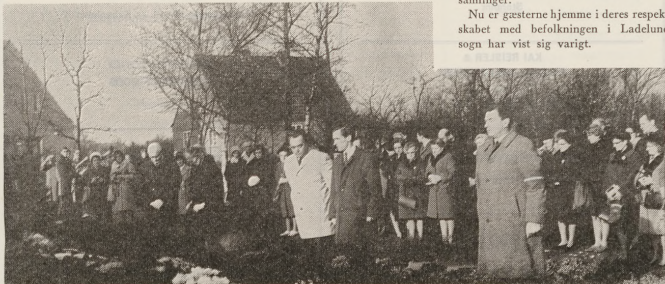
Ladelund på den tysk-hollandske forsoningsdag 23. november.

Nu er gæsterne hjemme i deres respekt med befolkningen i Ladelund sogn har vist sig varigt.