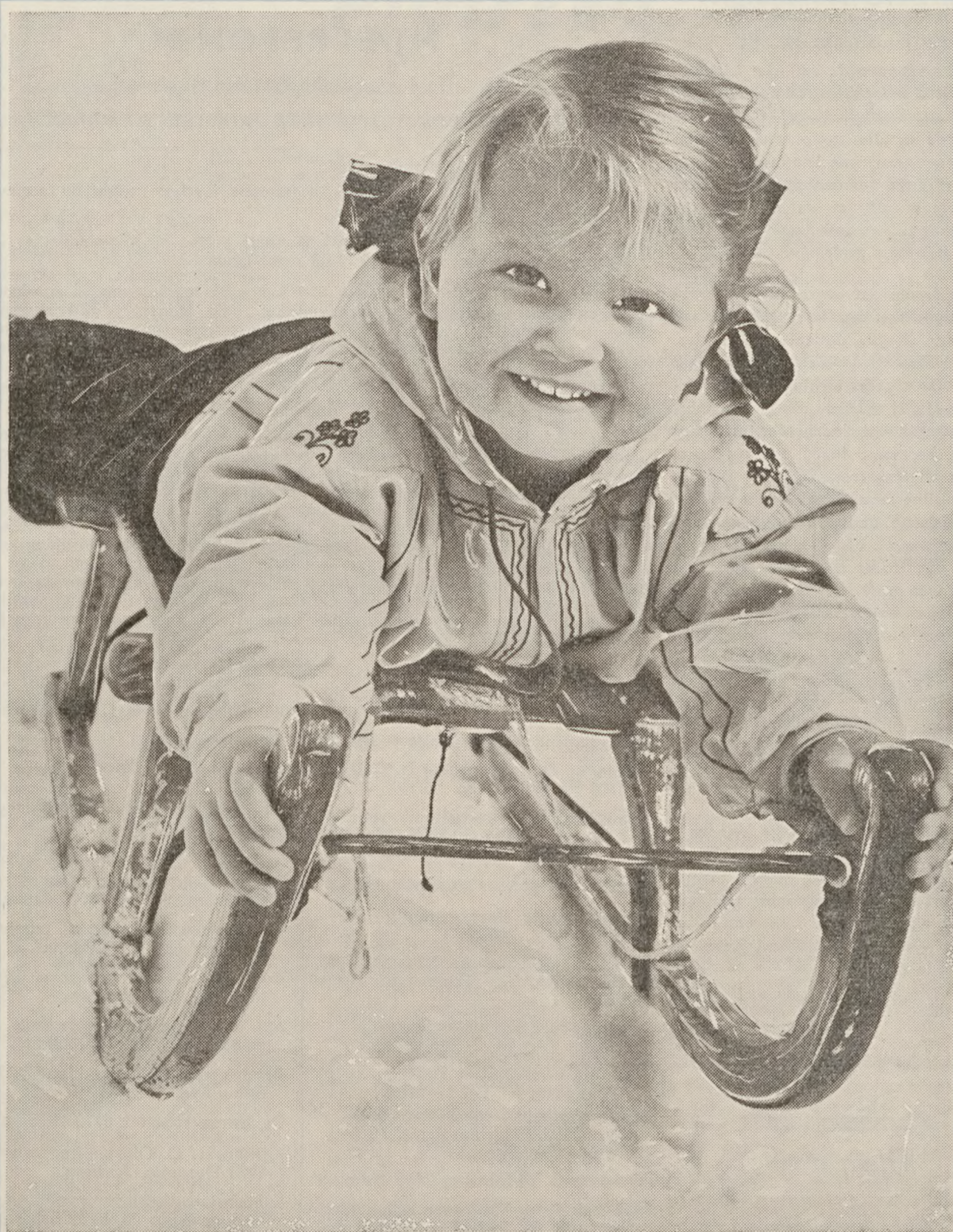
Vinterglæde i vinterkulde