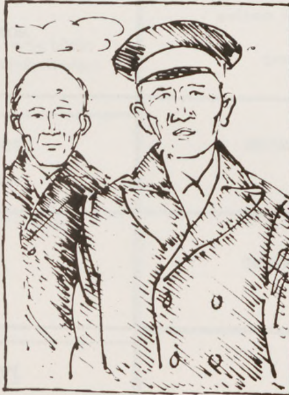
"Gå bare hjem — om ti minutter er russerne her."

Jeg rejste tilbage til Berlin for at hente mine forældre. S-togene kørte med præcis præcision selv om de i ny og næ måtte standse for luftangrebene. Passagererne krøb i dækning under træer og buske, indtil alarmer blev afblæst. Men det var ting, ingen tog særlig notits af. Det hørte simpelthen med til livet, der ikke mere kunne tænkes anderledes. I Berlin byggedes der barrikader alle vegne. Gamle sporvogne lå på tværs over gaderne, folkestormen var i aktion, og store, våde plakater opfordrede alle, der ikke var i værnemagten, til at melde sig i nærmeste partilokale for at blive indrulleret i denne civile garde.