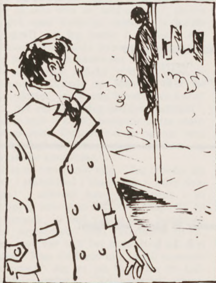
En mand dinglede i en lygtepæl — hængt.

Mismodige begyndte vi tilbagetoget. Vi nåede Berlin igen — og jeg vidste mere end de fleste om, hvor let denne såkaldte frontlinie kunne gennembry-