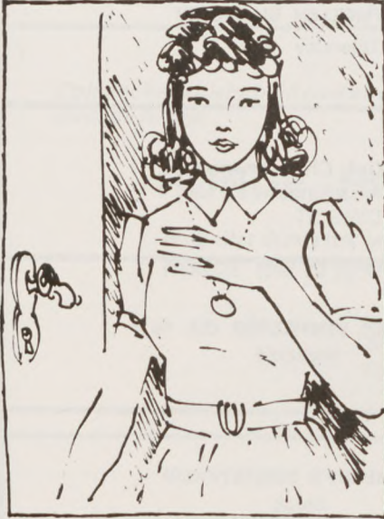
En ung pige, måske 17-18 år gammel, lukkede op.

selsport og russernes ankomst. Her havde vi — unge berlinske studenter — danset med landsbyens ungdom for femten, tyve år siden. Vore guitarer klang til folkesangene. Om natten var vi indkvarteret hos bønderne, der diskede op med alt, hvad huset formåede, til de muntre og fine gæster fra hovedstaden.