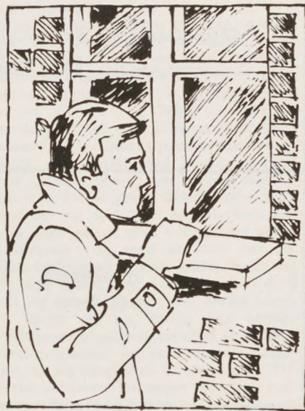
Jeg gik hen til skolen og kiggede igennem vinduet.

Foråret 45 i Tyskland! Endnu hører jeg rordrumsens basunkrig fra sivene og engdragene langs Spreefloden. Den snor sig igennem sumpe, moser og søer, kranset af lave og sandede morænebakker. Den kommer sydfra, fra gamle slaviske egne i Mark Brandenburg, og baner sig langsomt vej, ligesom famlende med masser af sidearme og små kanaler, et glinsende tusindben, langsomt på vej mod Berlin. Den kom-