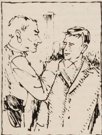
„Høiforræder“ — et klap på skulderen

Man havde talt om, at der var slægtninge i Hamborg, der kunne tage sig af pigen. Men levede de endnu?