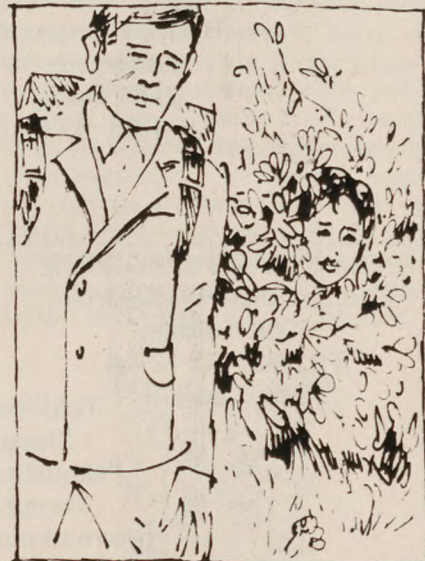
Walfraud gemte sig bag en busk i grøften!