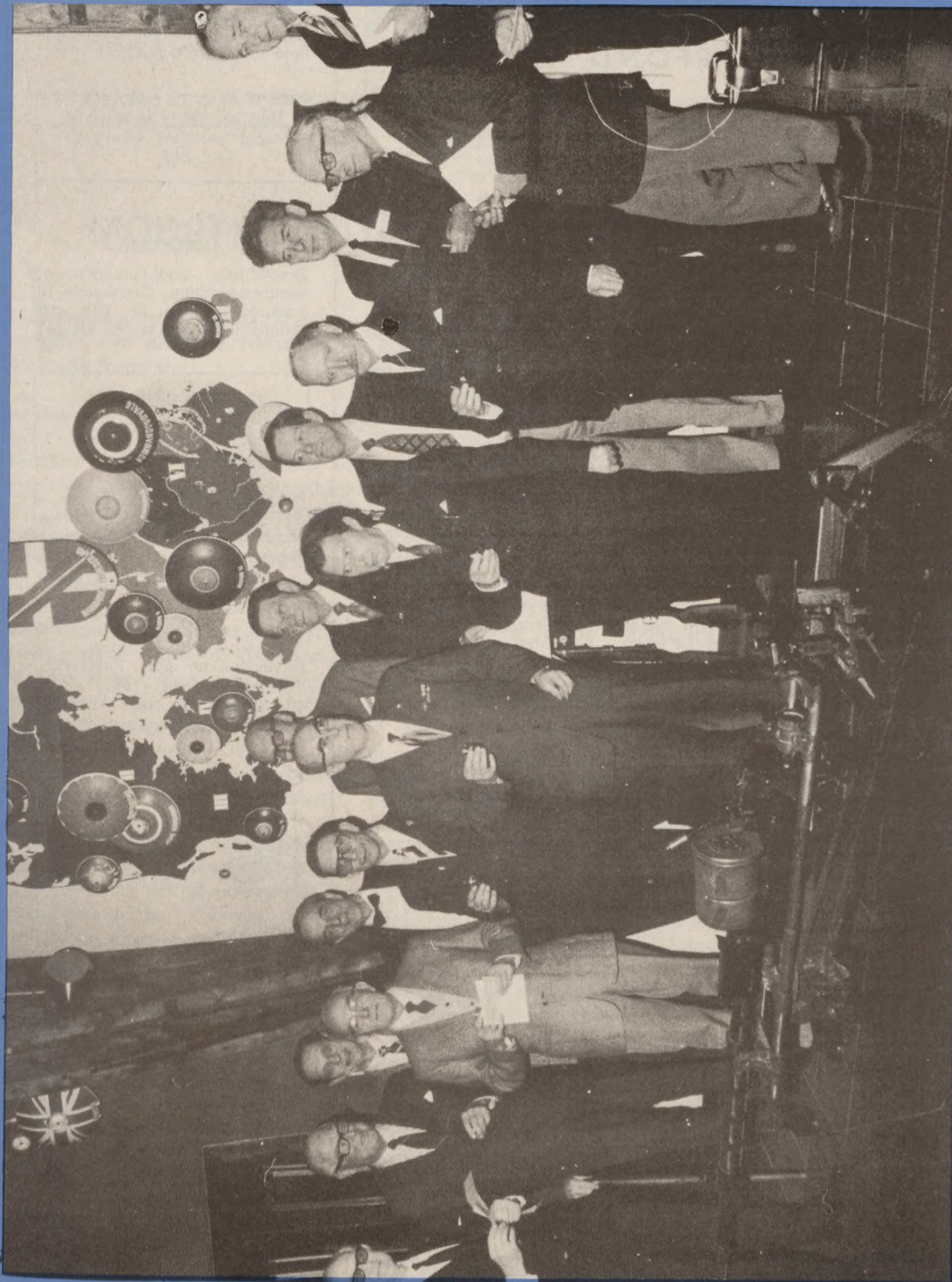
Udstillingen i Fruhedsmuseet blev den 2. januar vist for en lukket kreds, og ved denne lejlighed tog vor fotograf dette billede af en del danske, der har været med i allieret tjeneste, og som har ydet materiale til udstillingen.