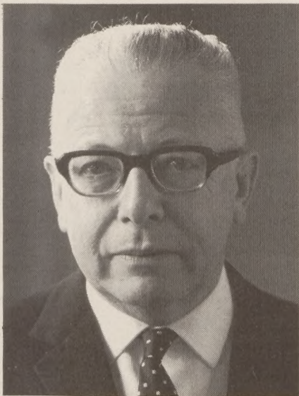
Dr. Gustav Heinemann