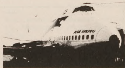
Den Jumbo-Jet, der i oktober 72 bragte 186 danske modstandsfolk til USA.