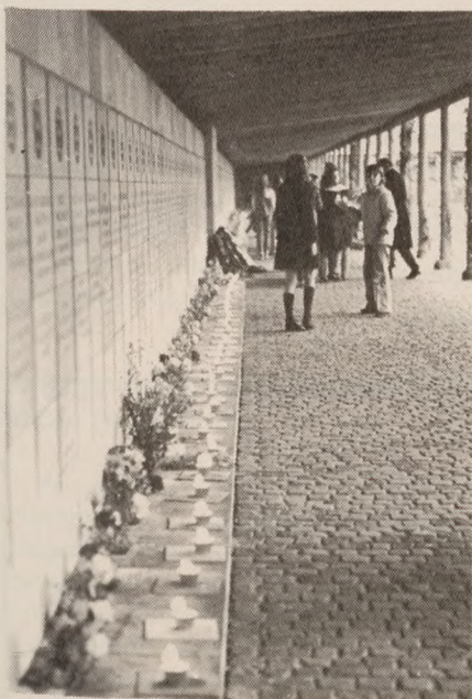
Ryvangen den 4. maj 1973. Blomster og lys hævdede sig smukt.

Vore legater gives til danske studerende, lærere og andre til studier i Israel indenfor deres respektive interesseområder. Legatmodtagerne udvælges