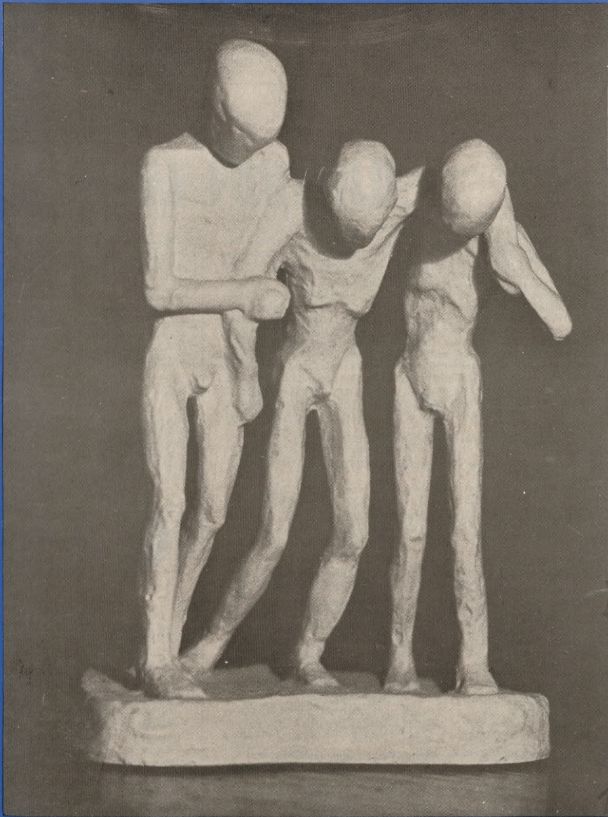
ÆRESSTATUETTEN Billedet viser Landsforeningen af kz-fanger fra Neuengamme æresstatuette, der er en afstøbning af en træfigur skåret af en dansk fange i Neuengamme 1944/45 og smuglet hjem til Danmark. Statuetten gives af Landsforeningen til personer eller organisationer, der ved deres virke har haft en særlig betydning for de tidligere danske fanger fra Neuengamme og deres familier.