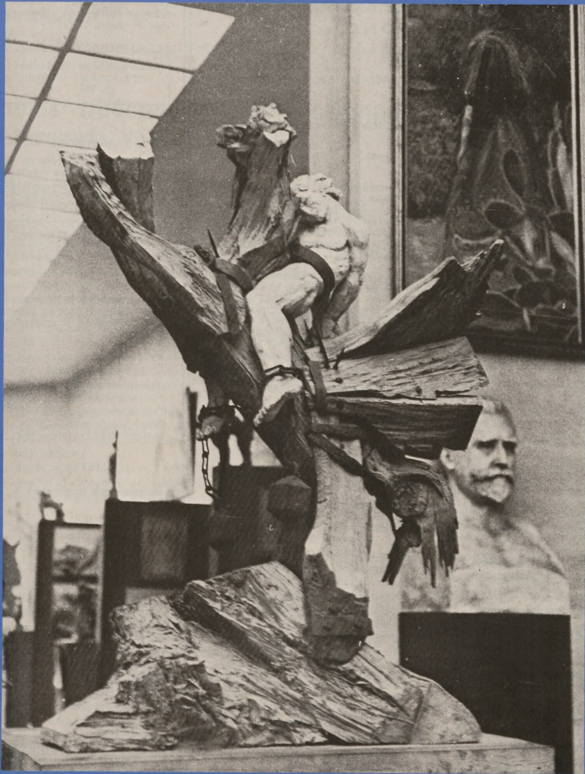
Rudolf Tegner "Besættelsen 1940-45" Tegners Museum, Kildekrog.