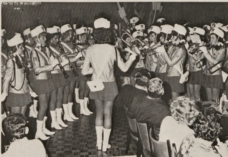
Gladsaxe pigegarde var et festligt indslag