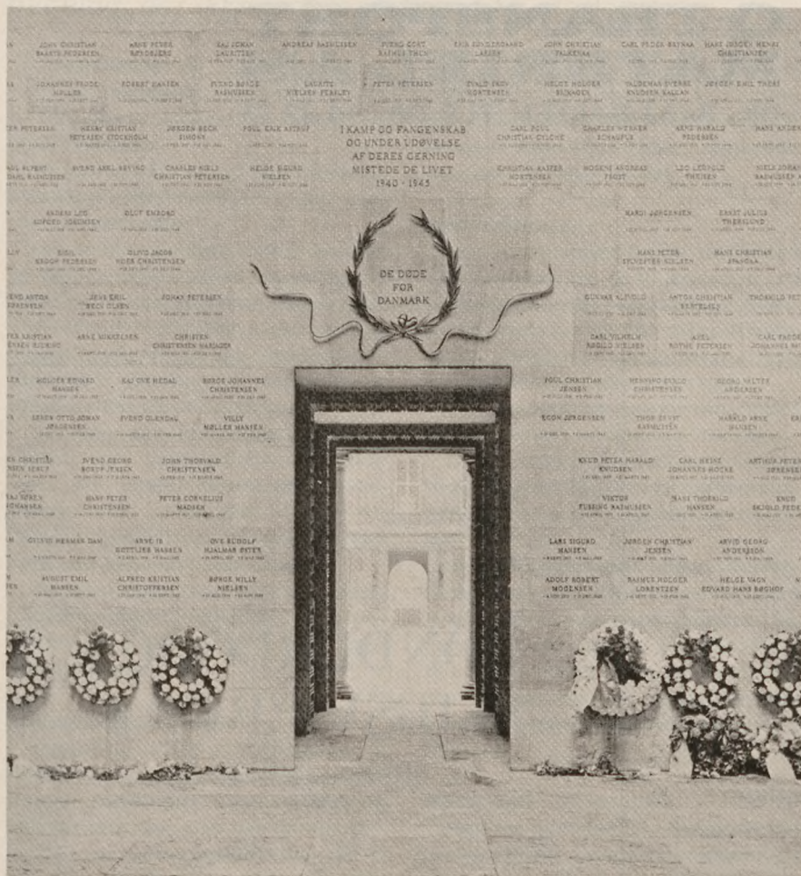
Den smukke mindehal på Politigården i København med 155 navne på politifolk, som »I Kamp og Fangenskab og under Udøvelse af deres Gerning« mistede livet under Danmarks besættelse 1940-45 – mange er døde siden da på grund af eftervirkningerne fra opholdet i de tyske KZ-lejre eller deres deltagelse i modstandskampen.

30 år siden den falske luftalarm, der resulterede i, at næsten 2.000 danske politifolk deporteredes