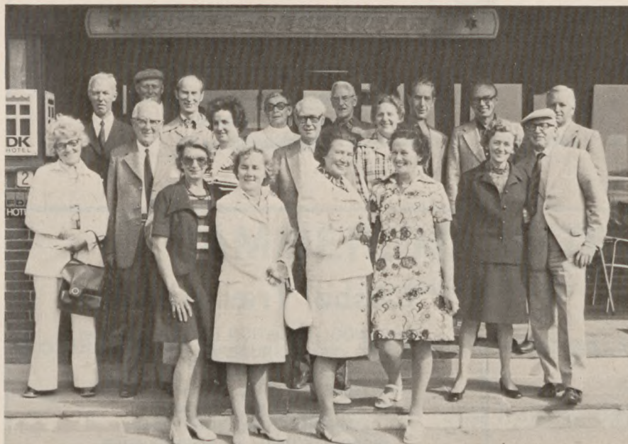
Deltagerne samledes foran hotellet i Hanstholm

I tiden omkring 24/25 aug., dagen for vor transport fra Aarhus Arrest til Frøslev, samles kammeraterne fra stue 10 barak 14 i Frøslev.