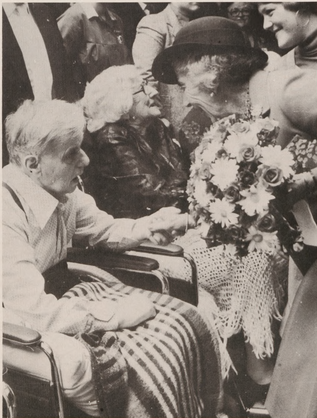
Dronning Ingrid hilser på beboer i Bernadotttegården ved indvielsen i Hadsund den 5. maj.