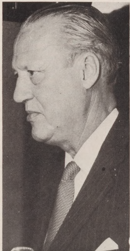
Prins Georg taler ved indvielsen i Hadsund.