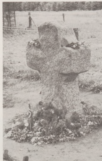
Hvor Kaj Munk blev dræbt på Hørbylunde bakke er der rejst et beskedent kors i granit.

Det sker efter forslag fra fredningsplanudvalget for amtet. Arbejdet udføres i løbet af det kommende år.