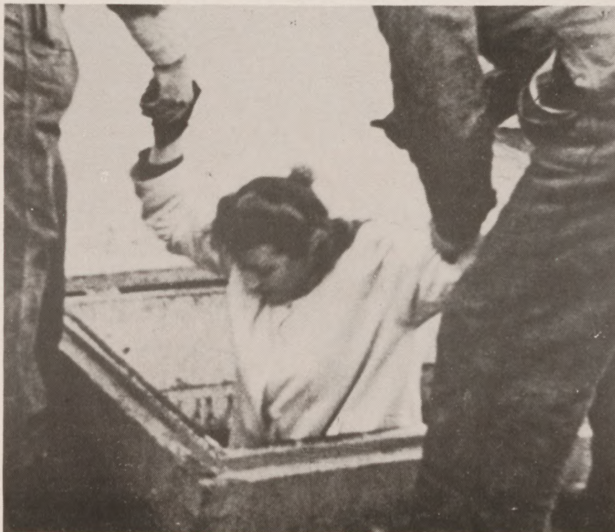
Oktoberdage: Flygtning søger ly i fiskerskipperens lasterum.

Det kan sikkert lyde underligt for mange af de unge, når man fortæller om disse spontane, højtidelige reaktioner. I dag, hvor de fleste af os synes, at højstemthed eller »ha-stemthed« er begreber, der er lidt latterlige.