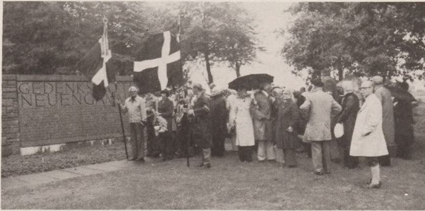
Man samledes ved mindemuren i Neuengamme.