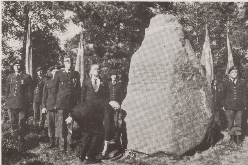
Fra indvielsen på Skæring hede: General Orla Nørberg nedlægger som den første blomster ved mindestenen. Bag ham grev Ingolf af Rosenborg.

Sidste kapitel af en af de mest omtalte danske sabotageer under besættelsen, aktionen mod jernbanebroerne ved Langå, blev skrevet den 17. sept., da grev Ingolf som repræsentant for kongehuset afslørede en mindesten på Skæring Hede ved Århus.