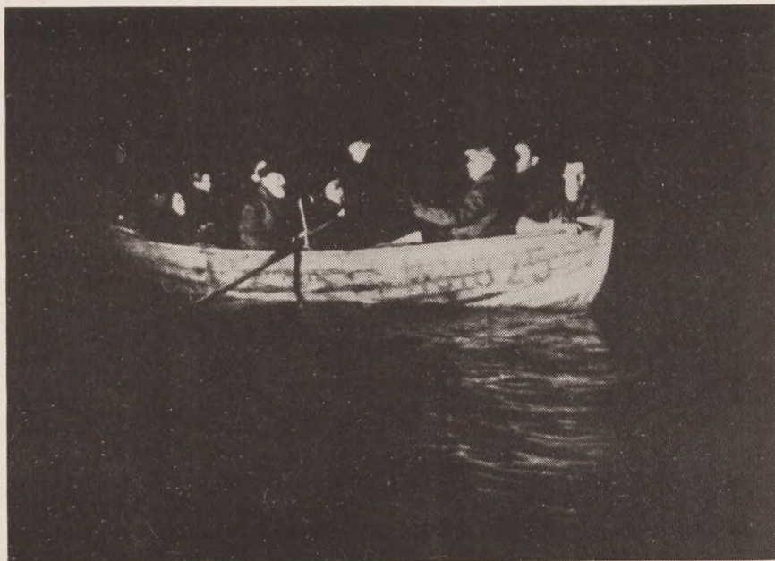
I oktoberdagene foregik flugten i en del tilfælde om natten i robåde.

Men i den situation, vi dengang var, virkede det helt naturligt.