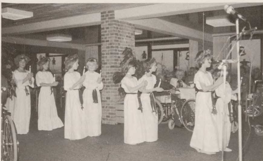
Luciaoptog ved julefest i 1978.