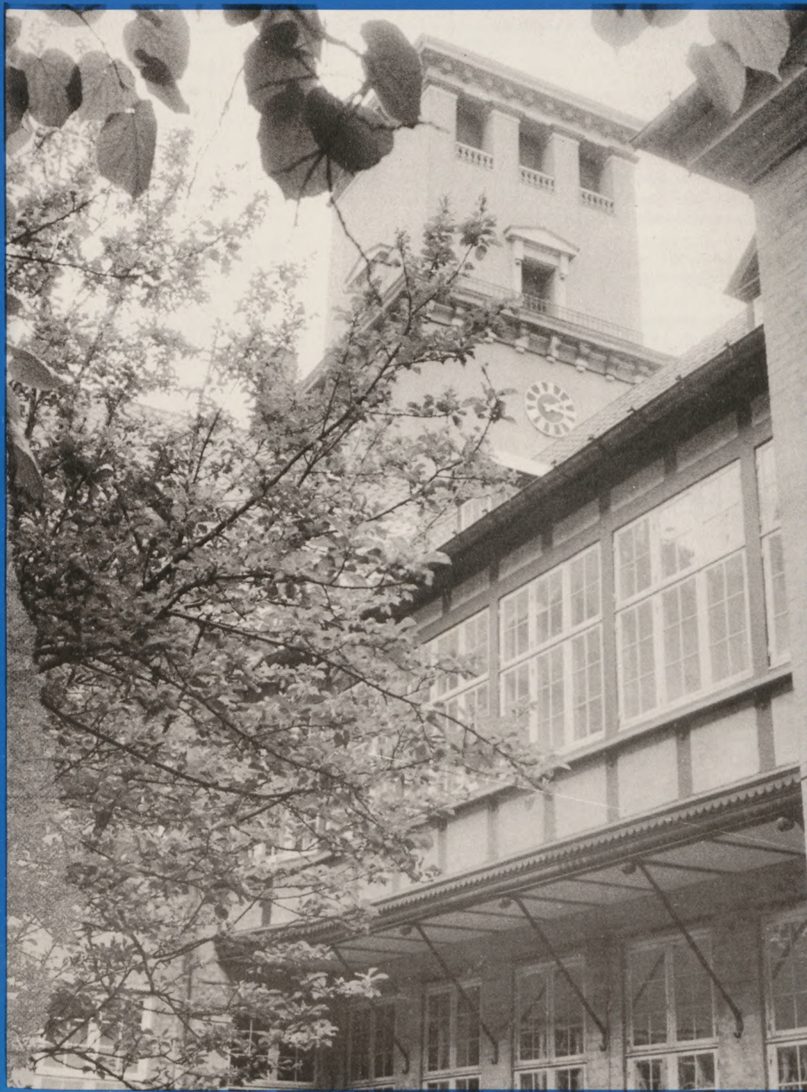
Bispegården i København med domkirken i baggrunden. Biskoppens julehilsen bringes side 167.