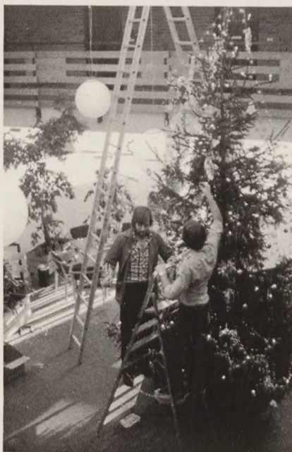
Juletræet pyntes (1978).