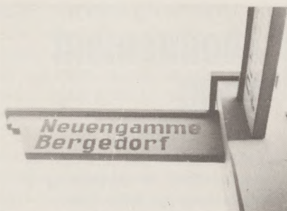
Et vejskilt vi kender alt for godt.

der skulle gå endnu flere måneder, inden vort ønske gik i opfyldelse, for krigen fortsatte ubarmhjertigt, og med den vor længsel efter vort lille Danmark.