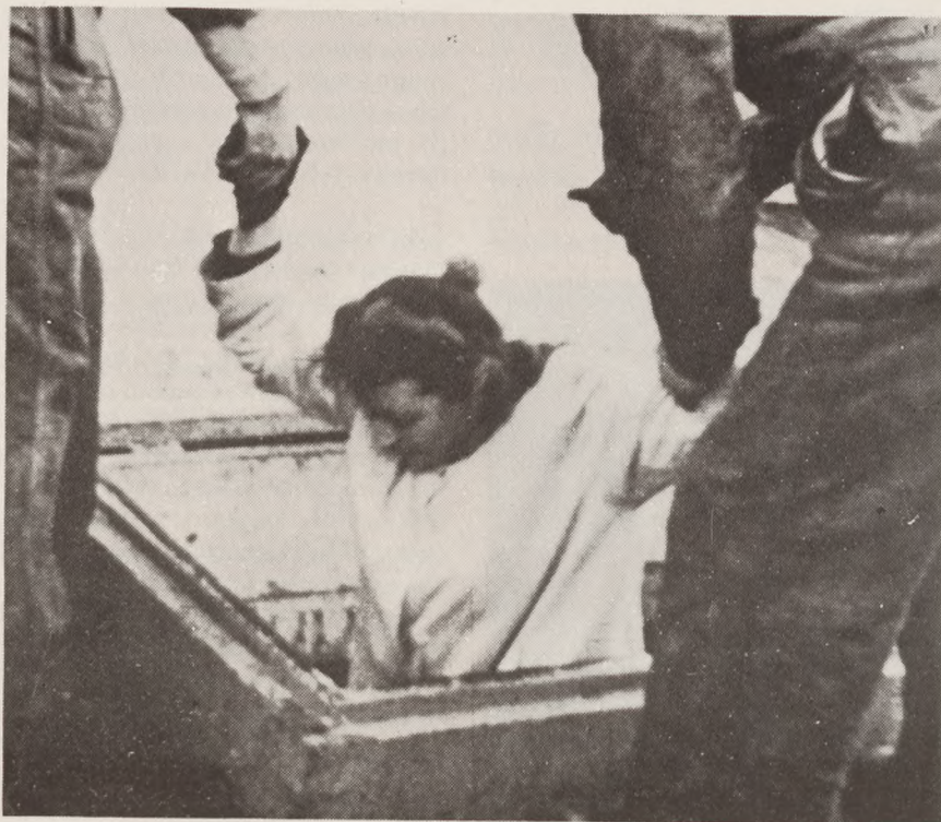
Flygtning søger ly i fiskerskipperens lasterum.

mig om snarest muligt at komme til hovedstaden, hvor han, sammen med en kammerat, ville tage mig med på en rotur... Jamen, hvad tænkte de herrer dog på? Jeg havde mand og tre mindreårige børn. Dem kunne jeg ikke sådan forlade på grund af en rotur.