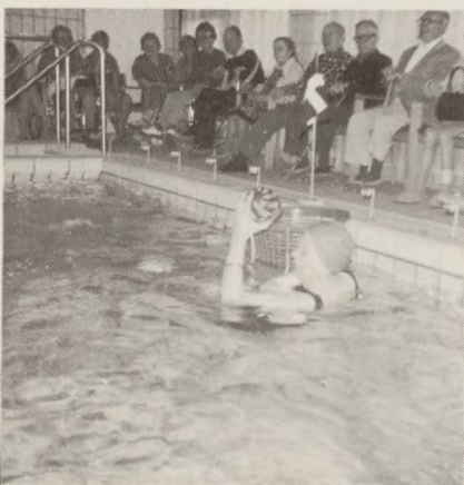
Svømmekonkurrence i Bernadottegårdens svømmebassin.