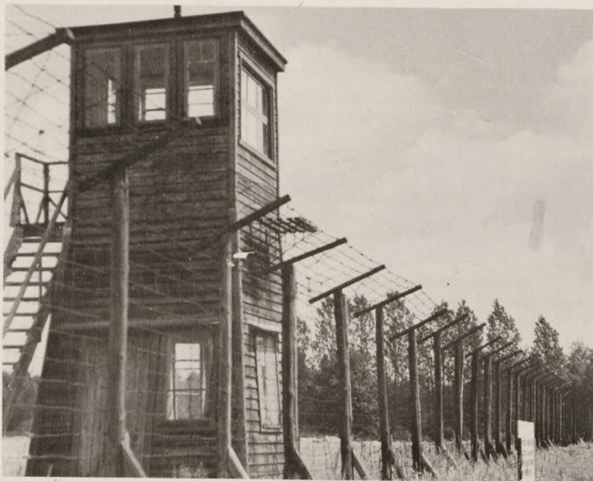
Vagttårn i »Gamle lejr« i Stutthof.