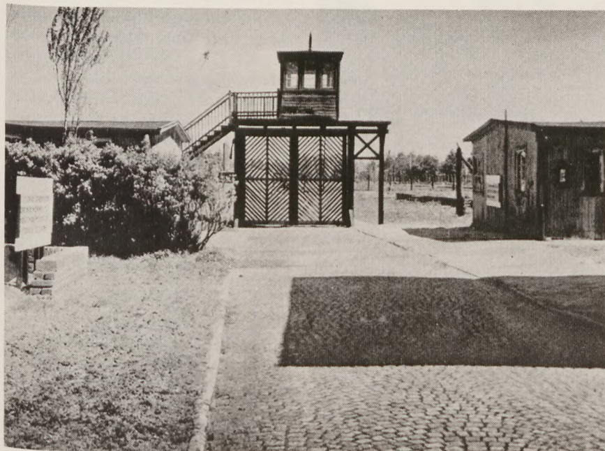
Indgangen til »Gamle lejr« i Stutthof, henrettelsesstedet for 85.000 fra besatte lande i Europa.

Den 2. oktober 1943 afsejlede et tysk transportskib fra Langeliniekajen i København med en last danske fanger. Det var dels den første transport af jøder, der skulle deporteres til Theresienstadt, og som var blevet jaget og fanget af tyskerne i dagene umiddelbart forud. Og det var de 150 Horserødfanger, det ikke var lykkedes at flygte den 29. august, og som for manges vedkommende havde været arresteret siden 1941 (kommunistloven). De blev nu deporteret til Stutthoflejren, ca. 50 km øst for Gdansk (Danzig).