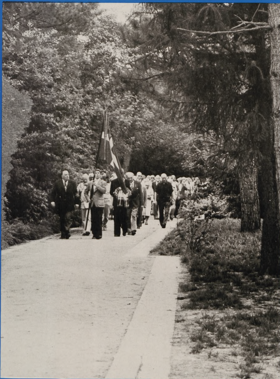
Ved den årlige pilgrimsfærd til lejrene ved Emskanal og Neuengamme i dagene 4. til 7. september 1980, deltog 93 danske fra hele landet i denne færd. På billedet ses den store forsamling ved indmarchen til kz-kirkegården ved Esterwegen.