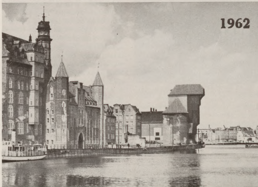
Havneparti i Gdansk før og nu.

chere i stram takt med huen i hånden stramt ind mod låret.