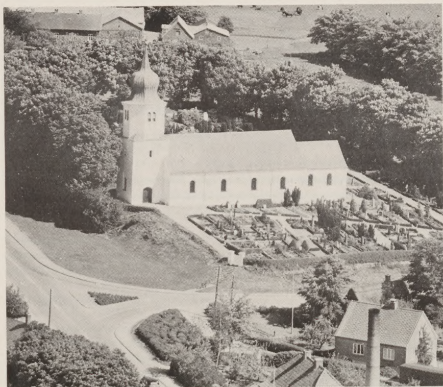
Nr. Galten kirke ved Hadsten, rummede illegalt våbenlager under kirkens alter.

nering, tobaksavl på Fyn, ulovligheder udført med god samvittighed - og benzinesvær.