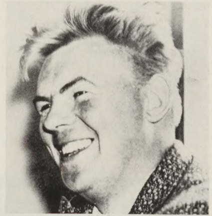
Forfatteren, skolemanden og politikerne Arne Sørensen.