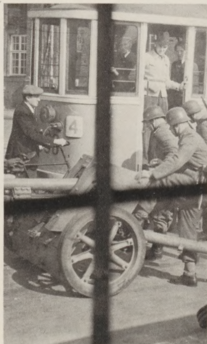
19-9-44: Tysk kanon i stilling ved Politigården i København.

2/9: Statsminister Buhl holder tale imod sabotagen. 5/9: Overbetjent skudt af dansk faldskærmsmand under anholdelsesforsøg. Faldskærmsmanden begik derefter selvmord.