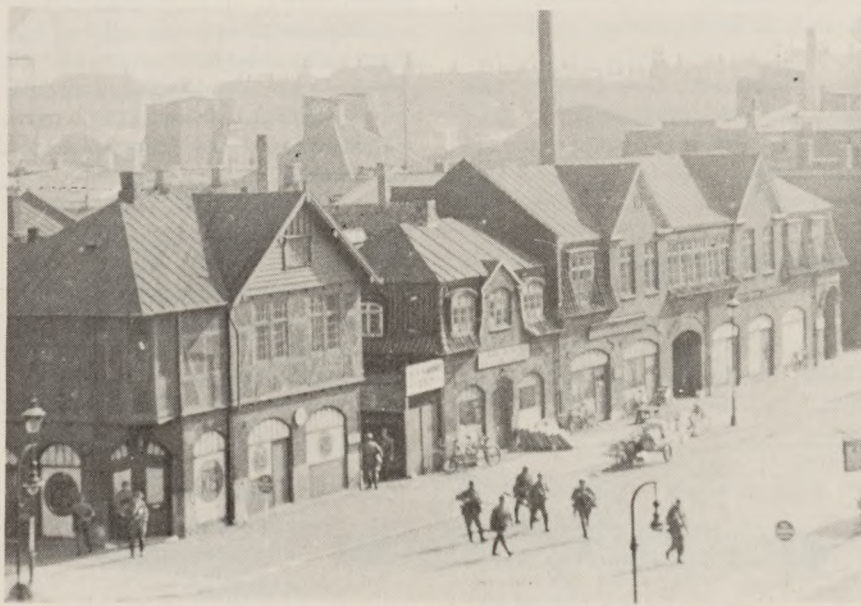
Tyske soldater rykker frem mod Politigården i København.