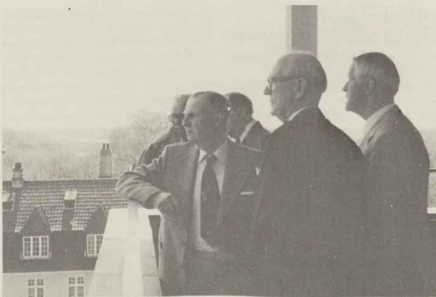
Deltagerne i Buchenwald-Klubbens møde i Odense, blev modtaget på Rådhuset, og man nød også den smukke udsigt fra Rådhusets balkon.

Københavnsklubben, der har en halv snes medlemmer rundt om på Fyn, havde inviteret disse medlemmer med damer til at deltage i arrangementet og fortsatte dermed den tradition, der blev indledt i 1981 med et arrangement på