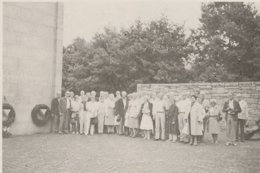
Buchenwald-Klubbens deltagere ved monumentet i Neuengamme.

Vi læste påskriften: »Euer Leiden, Euer Kampf und Euer Tod sollen nicht vergessen sein«, og vi forsøgte at synge sidste vers af »Altid frejdig«, men da brast det trods alt for de fleste af de gamle, hærdede politifolk, der i erindring om salmen, vi sang, når en kam-