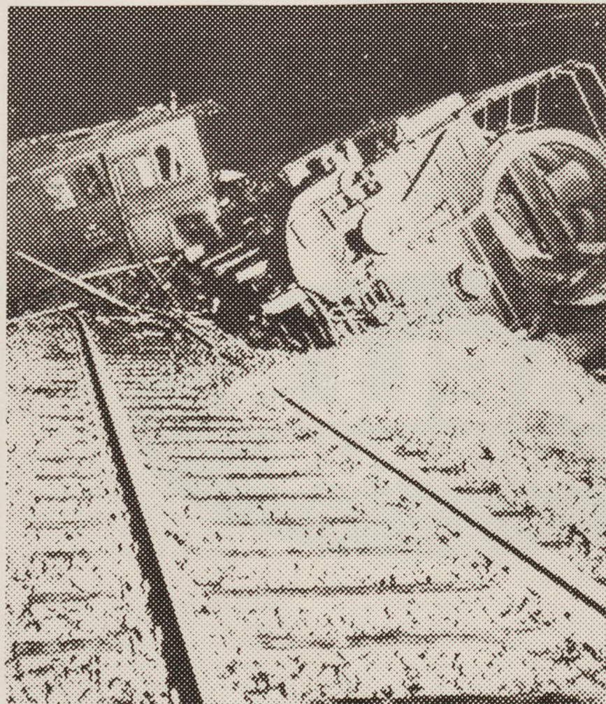
BOPAs jernbanesabotage ved Espergærde i november 1942.

med ham, tog det ikke så bogstaveligt. Så 22. juni, den søndag, da Hitler marcherede fra Polen ind i Rusland, anholdt det danske politi mange kendte kommunister. Det kostede ham et længere ophold i Horserødlejren i Nordsjælland. Dansk politi havde - med stor nævenyttighed - gennem nogle år opbygget et større kartotek over kommunister og sympatisører m.v. Et materiale, man siden brugte flittigt. Og til sidst overlod til Gestapo.