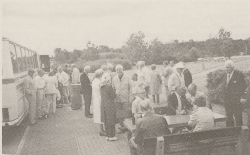
Buchenwald-folkene holder hvil på 3-dags rejsen til Neuengamme.