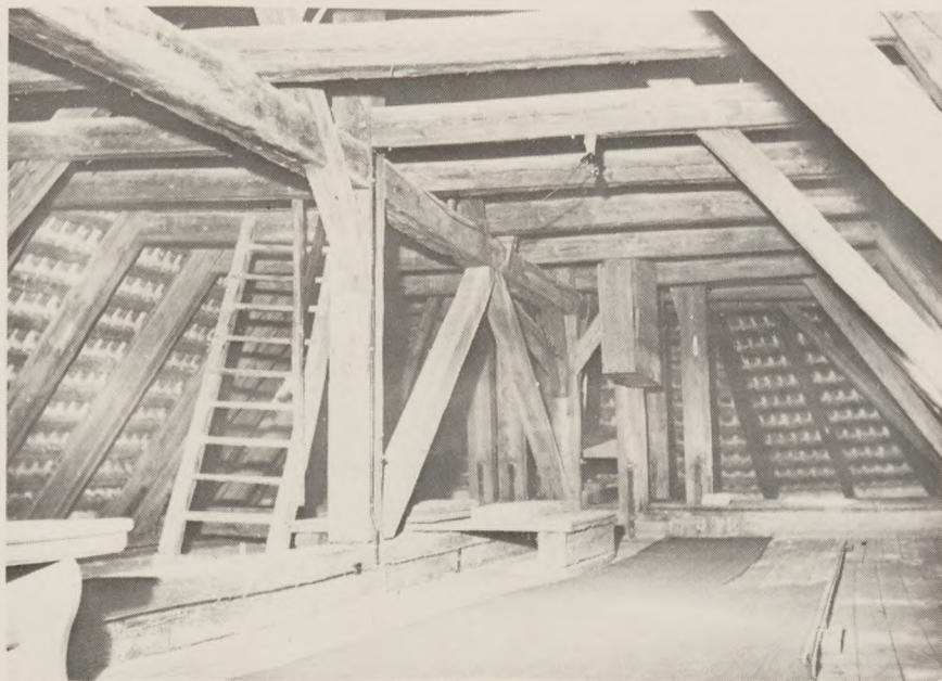
Kirkeloftet i Gilleleje, hvor 90 jødiske flygtninge tilbragte en vinterkold oktobernat, blev fundet af Gestapo, kropsvisiteret og deporteret til Theresienstadt.