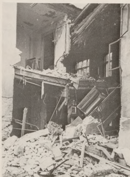
Oktober 1944: Den sprængte villa på Harsdorffsvej.