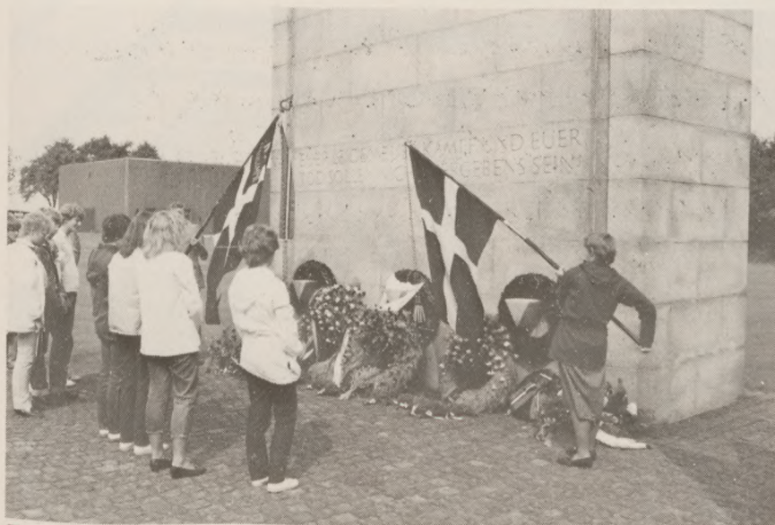
Elever fra Frøslev-Padborg skoles 10. klasse nedlægger krans og lyngbuketter, medbragt fra Frøslev. Fotografiet er taget ved hovedmonumentet i Neuengamme.