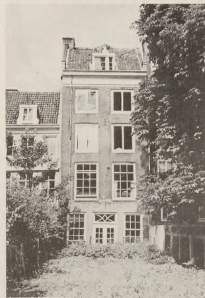
Anne Franks hus i Amsterdam, set bagfra. De to familier søgte at holde sig skjult på loftet.

Udstillingen indledes dér, hvor dagbogen holder op og gengiver indtryk af dagbogens historie og mangeartede virkninger, idet navnet Anne Frank er blevet et symbol på nazismens ofre.