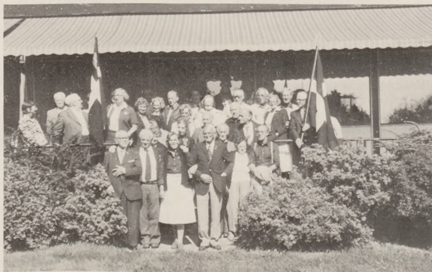
Nogle af stævnedeltagerne samlet på Molskroens terrasse inden afrejsen.