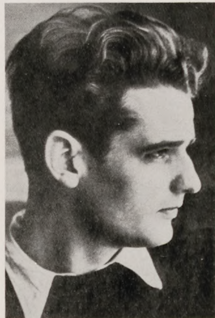
Hans Scholl, født 22/9 1918. Medicinsk student. Henrettet 22/2 43.