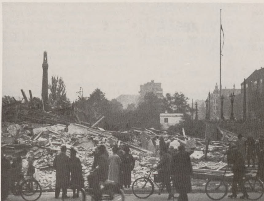
Efter en vellykket sabotageaktion ved Svanemøllen i København oktober 1944.