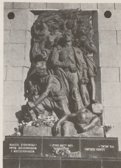
Det polske mindesmærke i den jødiske ghetto i Warszawa.

Om eftermiddagen var der en højtidelighed i Mindelunden, hvor den 2. oktober også blev mindet. Arrangørerne var Frihedskampens Veteraner og Det mosaiske Troessamfund. Og selv om vejret