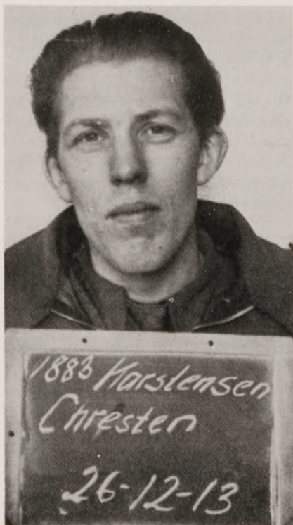
(Billedet fra Frøslevlejrens kartotek).

Samplings illegale arbejde. I sit gartneri havde han indrettet et illegalt trykkeri, og han var gruppeleder for en militærgruppe.