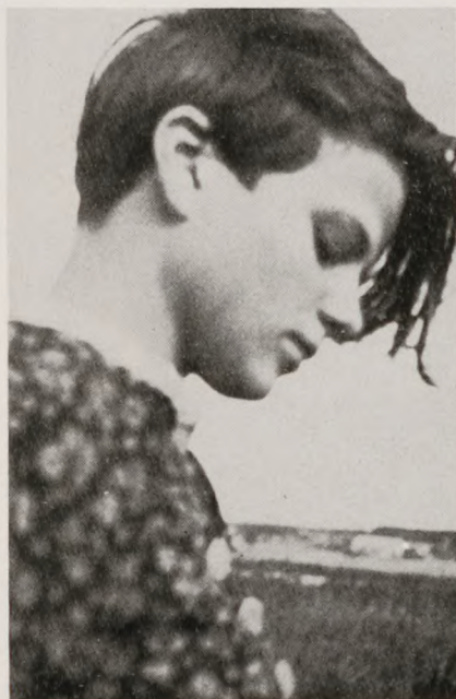
Sophie Scholl, født 9/5 1921. Studerede biologi og filosofi. Henrettet 22/2 43.