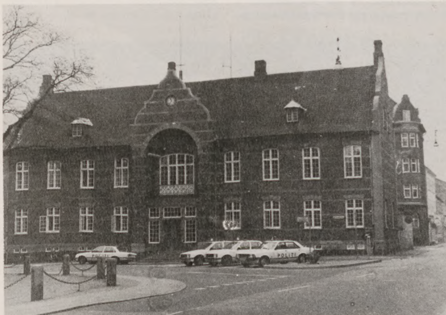
Den gamle politistation i Århus. I slutningen af besættelsetiden blev den brugt af Gestapo og deres håndlangere.