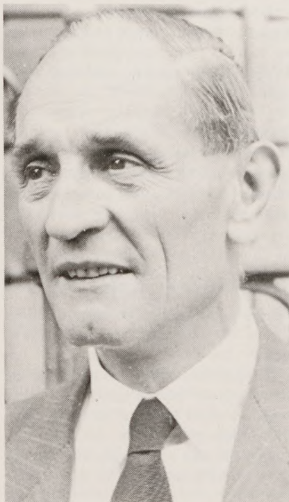
Den tyske kirkeleder Martin Niemöller, da han indledte sin kirkekamp i spidsen for Bekendelseskirken i Tyskland.

Nogle træk fra Pastor Martin Niemöllers liv