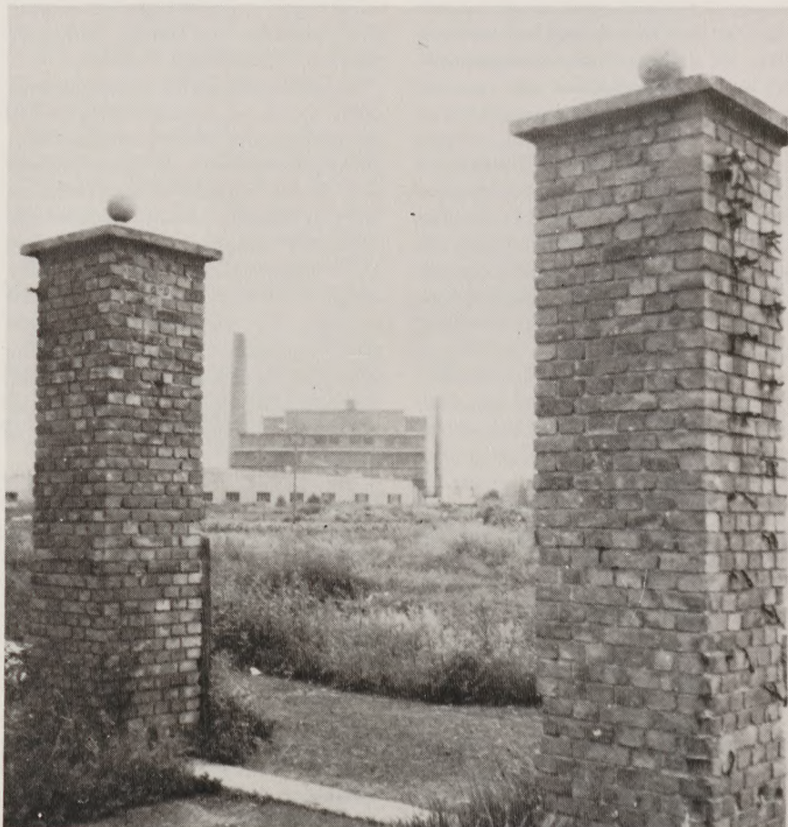
Dette foto fra Stöcken er taget i begyndelsen af halvtredserne. Mellem port-søjlerne var lejrens bagindgang, som vi skulle benytte når vi marcherede til og fra arbejde. Senere blev søjlerne væltet, og i dag er de væk, men fabrikken ligger der stadig. Den kører på fuld kraft, og dens akkumulatorer og batterier kan også købes her i landet. Navnet er: VARTA!