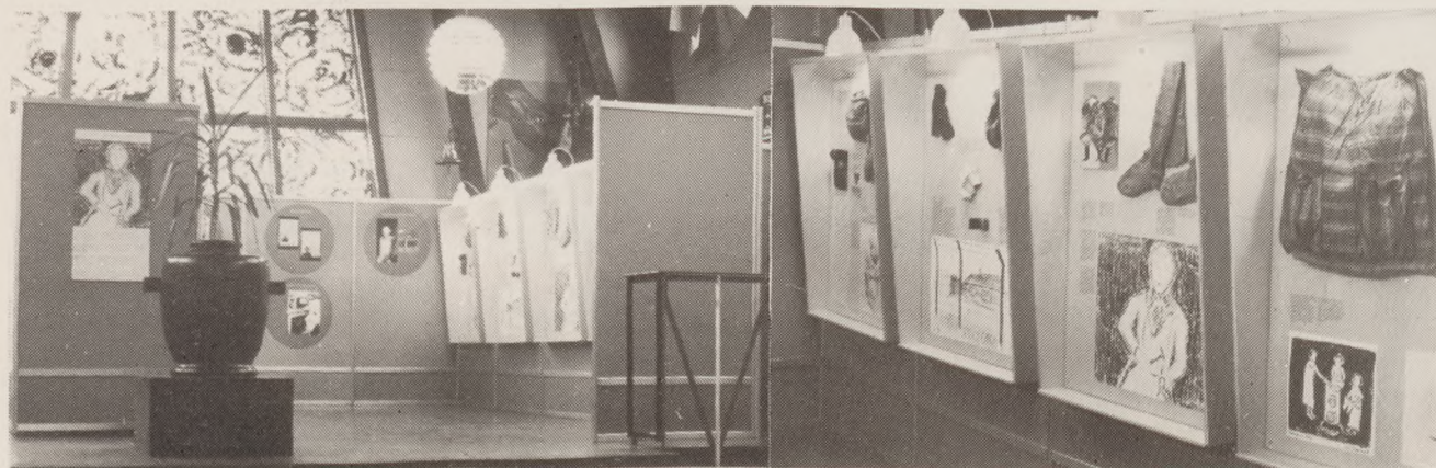
Frihedsmuseets nye faste udstilling i kz-museet Ravensbrück er nu sat op. Udstillingen vistes, som det ses her, i oktober på Frihedsmuseet inden afsendelsen. I Ravensbrück er de 9 plancher og 4 montrer opsat i en celle i den restaurerede cellebygning.