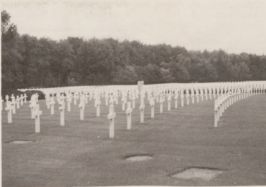
Kirkegården i Hamm med faldne USA-soldater fra kampene om Ardennen.

hvidt kors af italiensk marmor. De jødiske greave har dog en jødestjerne.