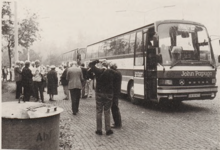
Rejsen startede fra holdepladsen for rutebiler ved Sjælør Station.

Det blev et gribende møde med de mange grave for de ofre, som USA bragte i de afgørende slag om Ardennerne. 8.411 faldt, og i Hamm hviler 5.076. Gravene er alle markeret med et