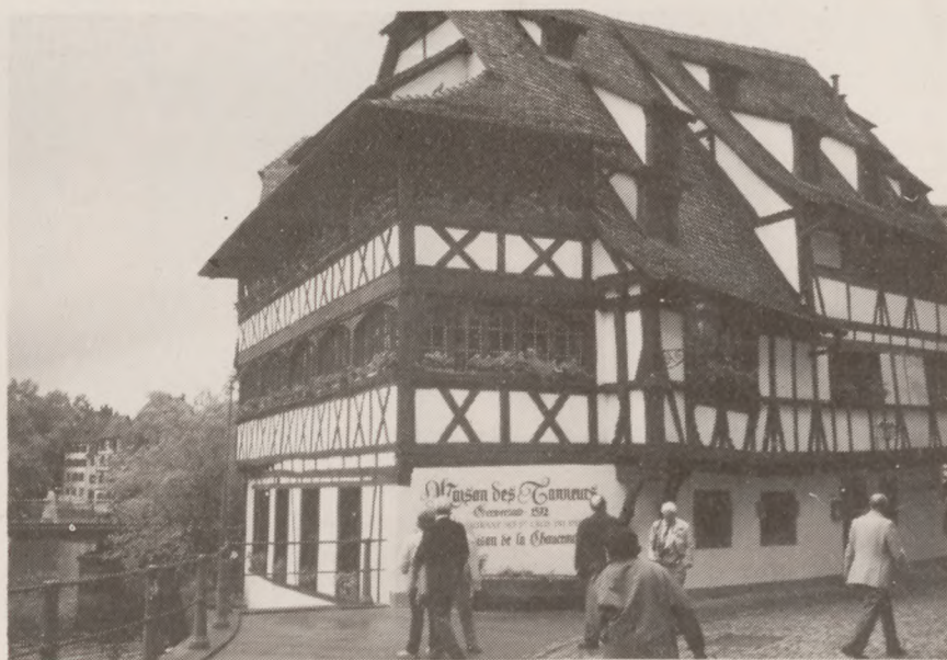
Man studerer et af husene i »Det lille Frankrig«. Det er stedet i Strasbourg, hvor alle typer af franske huse er samlet.

Det aktuelle, vi mødte i Strasbourg, var, at vi ret snart skal ind i det indre marked med sine standardordninger, grænsenedbrydninger, så f.eks. hver dansker kan rejse overalt i de 12 lande uden at skulle vise pas, den frie kapitalbevægelse og harmoniseringen. Det blev af flere af vore repræsentanter i