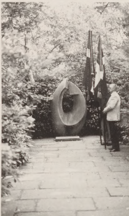
Deltagerne i pilgrimsfærdens 1988 samledes ved mindesmærket i Dalum. Her omkom samtlige fanger.

Redegørelsen offentliggøres her, idet den bør findes et let tilgængeligt sted, hvortil man i givet fald kan henvise. - En tysk oversættelse fordeles i øvrigt til de seks-syv vigtigste institutioner og lærde i Tyskland.