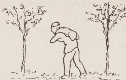
Hjem med madvarer

Efter midnat, da han måtte begynde at tænke på hjemturen, vovede han me-