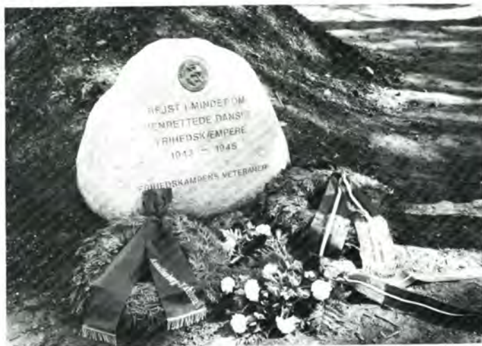
Den nye mindesten i Ryvangen er anbragt ved revolverbanerne.

Man skiltes med følelsen af, at man havde haft en rig