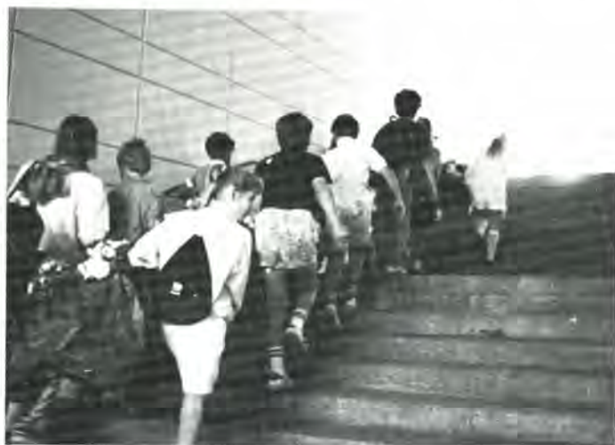
Der er mange trapper på Tuborgvej op til Mindelunden.

Ryvangen kalder stadig minder frem. Lad mig nævne 29. august 1945, da Københavns biskop indviede stedet til begravelsesplads. Jeg husker, at vi var 8-9 præster, der efter indvielsen skulle forrette jordpåkastelse ved hver en-