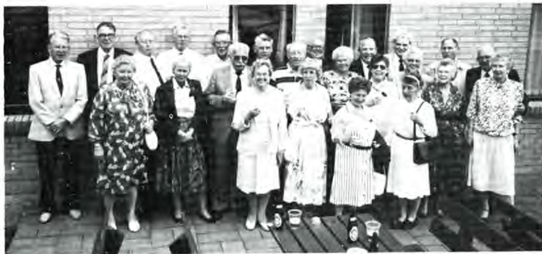
De fynske medlemmer af Buchenwaldklubbens Københavnsafdeling samlet i Midtjyllands Fritidscenter i Ringe den 9. maj 1990.