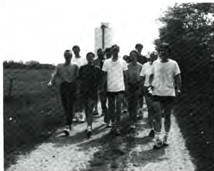
Stafetløberne fra Neuengammen ankommer til Ladelund.