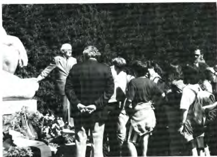
Elever fra Carolineskolen besøgte Mindelunden i Ryvangen den 4. maj. Rektor havde ønsket, at de skulle starte ved fællesmonumentet, og her fortalte F-k om Mindelunden før og nu.

kelt kiste. Jeg ser for mig hele situationen med de mange kister, når jeg fra indgangen går forbi de to første rækker (»mine« rækker), hvordan jeg dengang gik fra kiste til kiste, idet jeg sagde kirkens sidste ord under jordpåkastelsen.