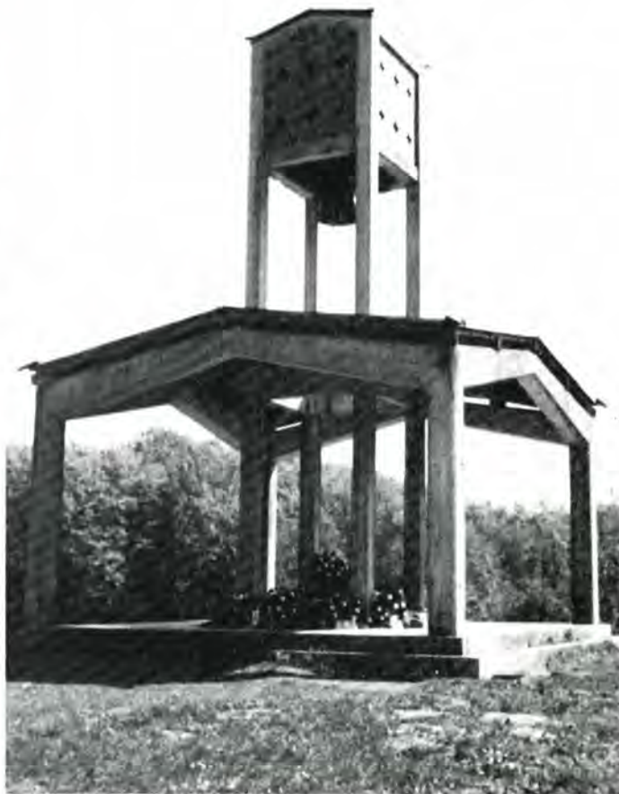
Klokkestabelen på Skamling. Nederst ligger mange farvestrålende kranser.

Stykket er blevet mest kendt i en orkesterversion af Henry Wood og benyttet som kendingsmelodi for de danske udsendelser fra BBC 1940-45.