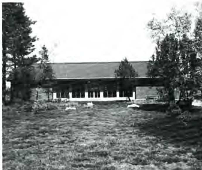
Gedenkstätte Ladelund.

Kronprinsen modtog på Holmen en parade med deltagelse af 305 veteraner af en brigade, som i maj 1945 talte 5000 soldater og lotter, inden han i helikopter fløj til Rebild.