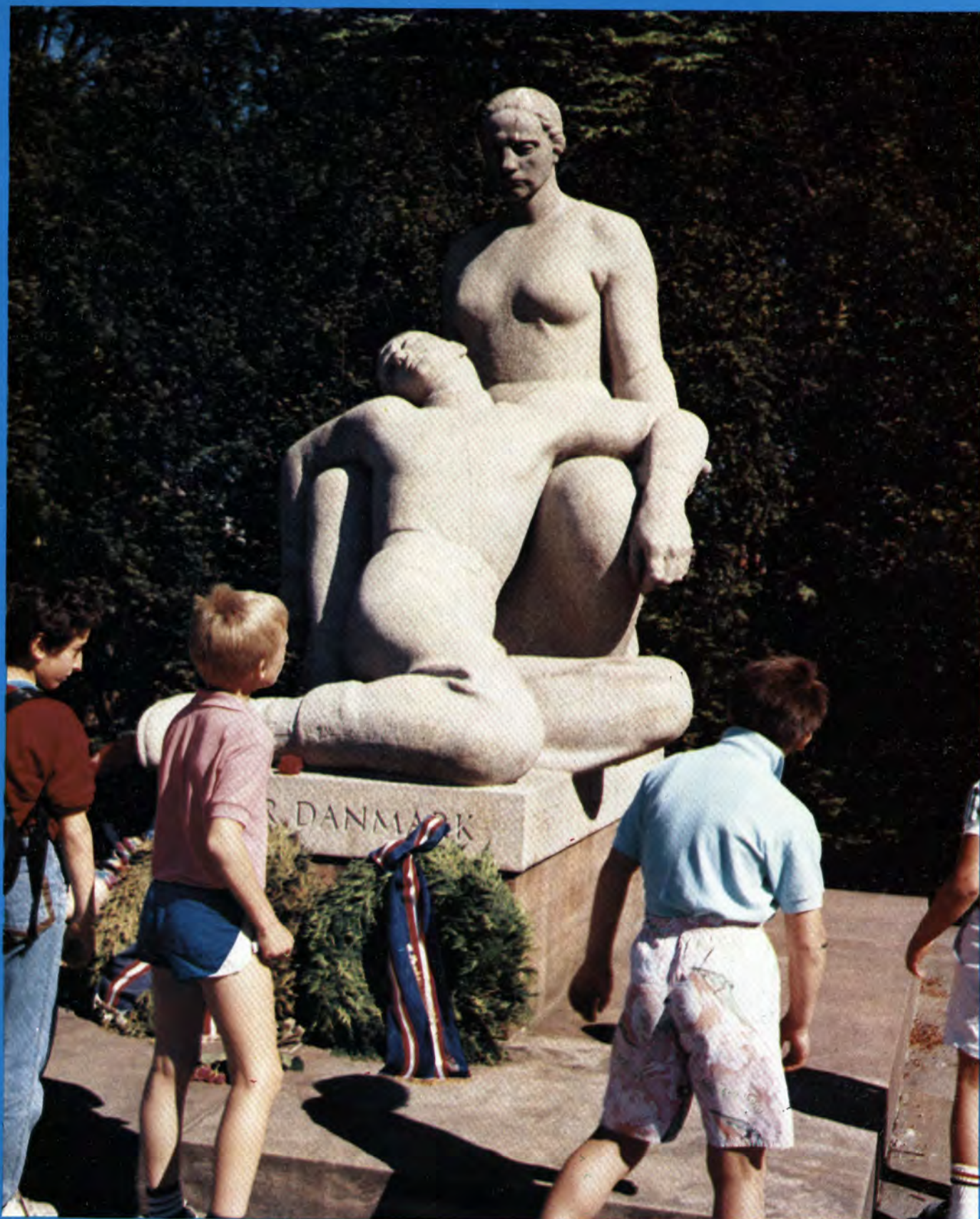
4. maj i Mindelunden i Ryvangen. Det er formiddag.