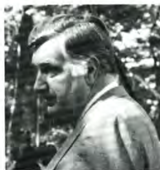
Kirkeminister Torben Rechendorff talte i Mindelunden.