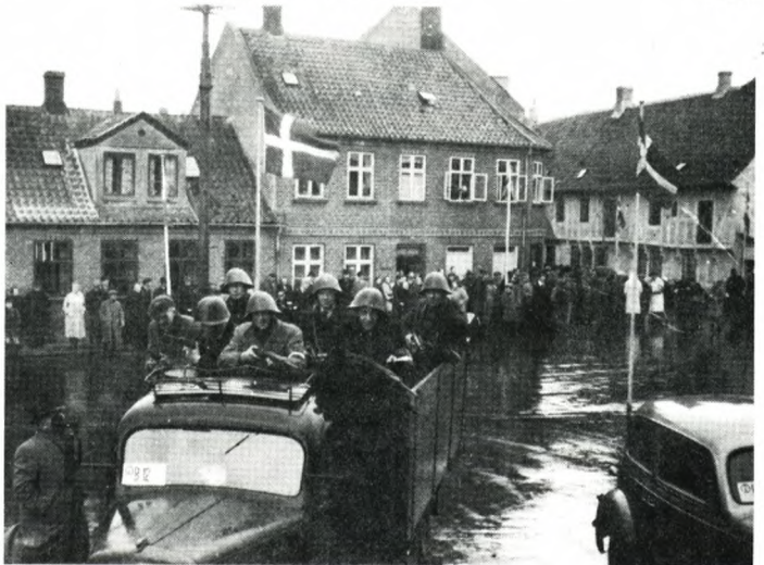
Rådhuspladsen i Bogen den 5. maj 1945.