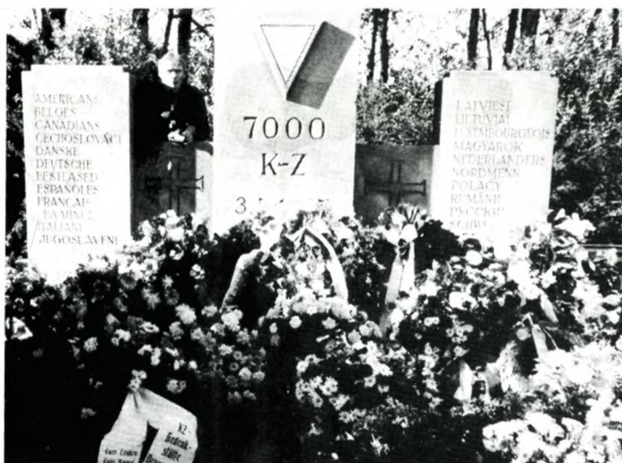
Mindesmærket for ofrene fra »Cap Arcona« ved Pelzerhagen ved Neustadt med et væld af kranser.

svarlige og hr. Lange fra Neustadt for udvist støtte.