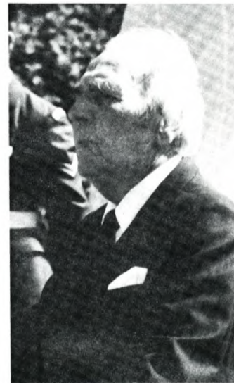
Toldstrup talte i Rebild

Som nedkastningschef opnåede han efterhånden at have 289 bemandede nedkastningspladser intakte. Samtidig var han chef for Region I, hvor han organiserede mili-