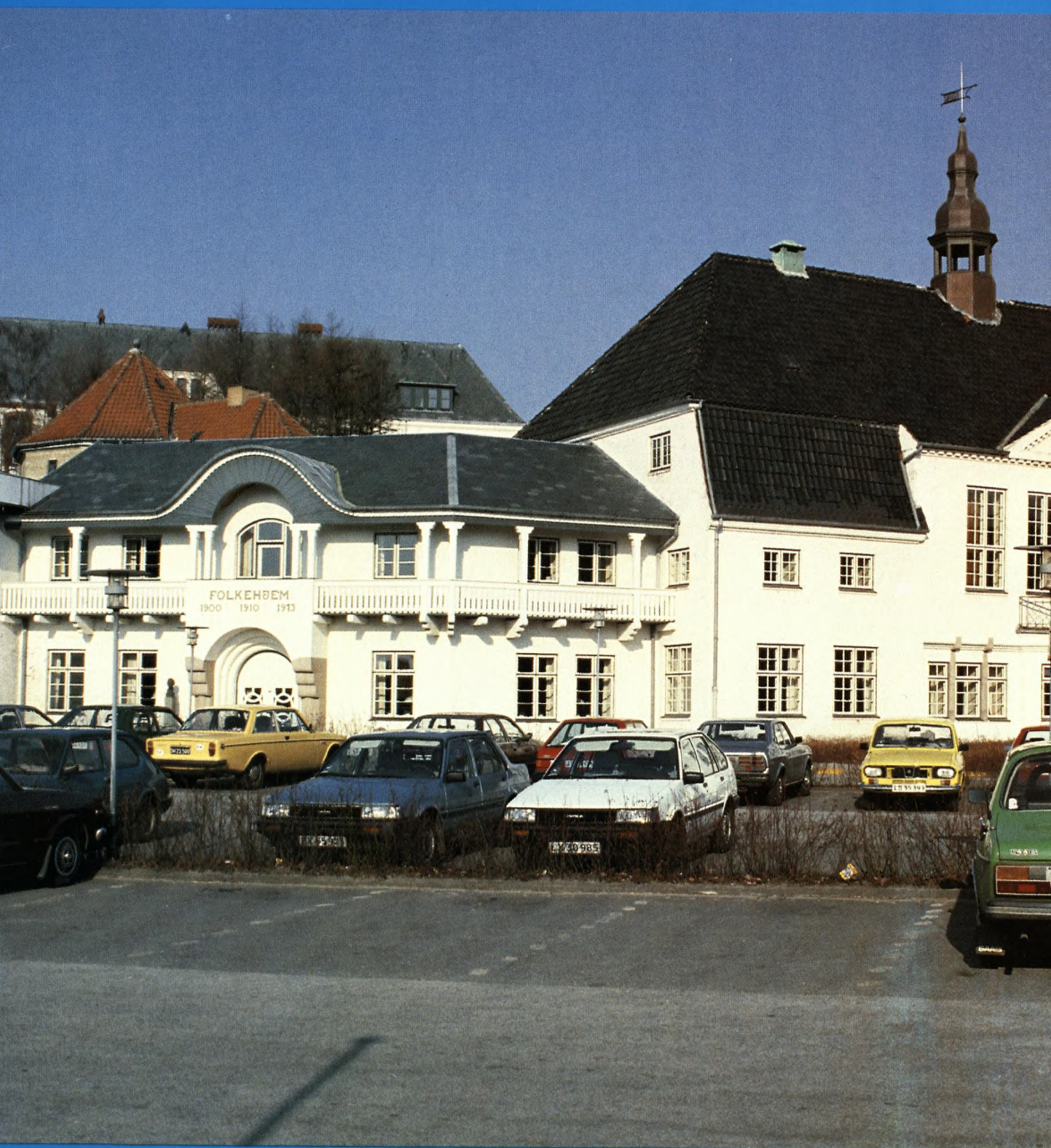
Aabenraa-kredsen fejrer 15. august 50 års jubilæum. Billedet viser »Folkehjem«, hvor kredsen blev stiftet.