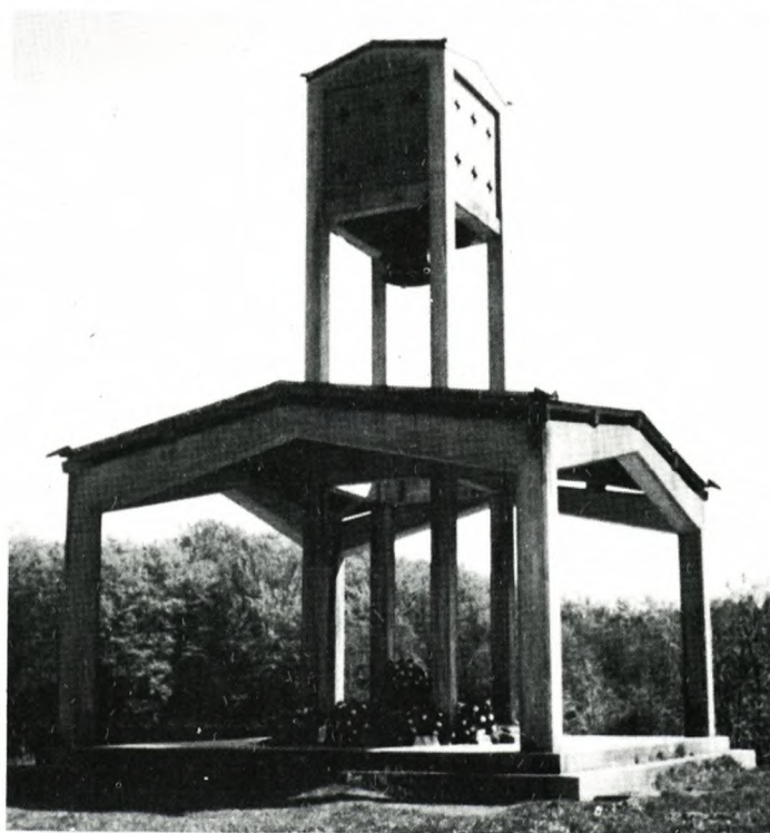
Ved klokkespillet på Skamling samler Aabenraa-kredsen sine medlemmer hvert år den 5. maj.