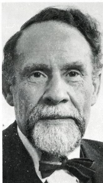
Frode Jakobsen får nu sit portræt hængt op i Folketinget.

- Det er store navne i danmarkshistorien, som gengives på malerierne i Samtaleværrelset på Christiansborg. Men Frode Jakobsens navn kan godt tåle sammenligning med disse store mænds.