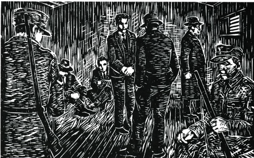
Transport af gestapofanger i kreaturvogne. Linoleumstryk af V. Glysing Jensen, Beder.

Stadig ophold på Northeim - stadig ingen mad - fik mad kl. 14.30, som vi selv måtte betale - første gang ude af vognen i 90 timer, men kun lige nede og røre jorden, så ind igen - det er frygtelig koldt om natten - vi ligger på det bare vogngulv, og jeg er ved at få liggesår på hofterne - vi har ikke været af tøjet, eller blevet vasket siden Vestre - jernbaneterrænet omkring os er flået op efter torsdagens bombardement - vi holder stadig på Northeim - vi har en blikspand til at forrette vor nødtørft i (53 mand).