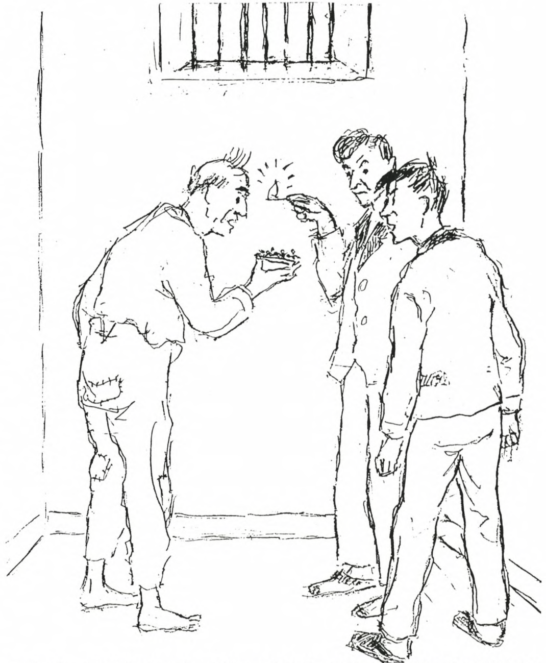
»Den frygtelige sandhed gik op for os alle tre på én gang: Det var kræmmerhuset med sukker, vi havde »druket« i wc-kummen

Da vi havde spist til aften og skulle træde af, rakte Bedstefar op på skabet og fandt kræmmerhuset med flueligene, og i procession bar vi ki-