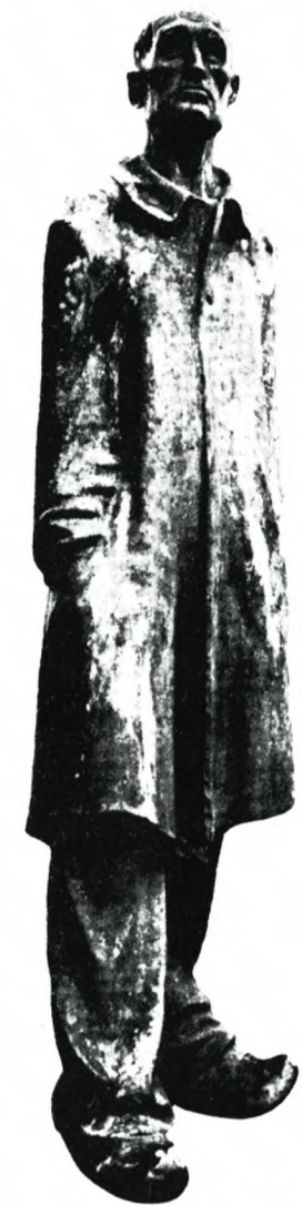
Vore tanker går ofte til Musel manden.

Ingen danske sendtes videre fra Dachau; derimod blev talrige andre fanger videretransporteret til stamlejrens udekkommandoer eller til andre stamlejre.