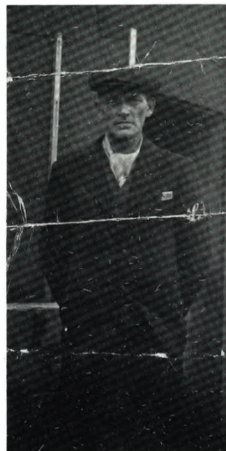
Illegalt foto fra KZ-lejren Blumenthal-Farge.

Manden på billedet hørte til dem, der var overført fra fængslet i Schwerin for at blive »overfange« - han afsøgte livsstraf for rovmord, han kunne behandle fangerne så råt, som det passede ham. Billedet er fra marts-april 1945.