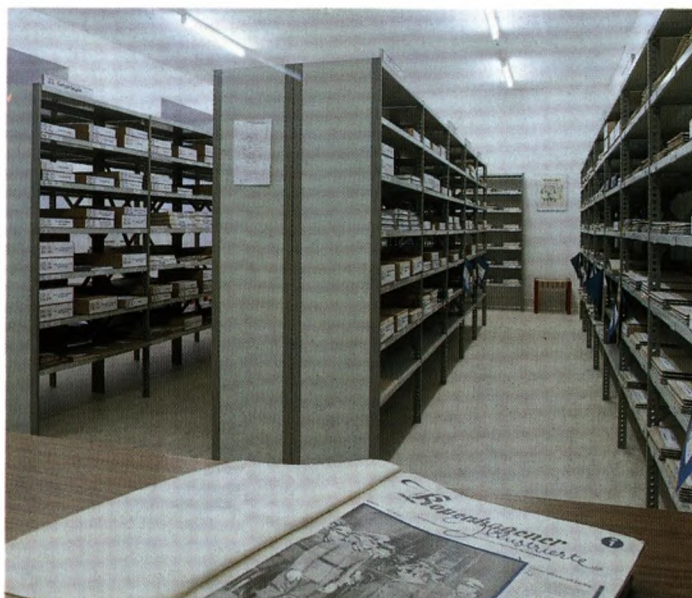
De mange dokumenter kræver megen plads. Her ser vi en del af de 212 m hyldedeplads.

Vi synes, at vi er nået et langt stykke ad vejen med hensyn til at få placeret det omfangsrige materiale og udarbejdet en række registranter indenfor de enkelte hovedgrupper, så det er blevet lettere at finde oplysninger om særlige begivenheder og centrale personer. Opdelingen i hoved- og undergrupper er foretaget efter samme model, som findes i Frihedsmuseets registrant, så at det skul-