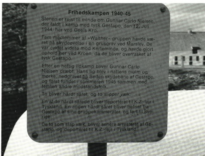
Mindetavlen ved Geels Kro.