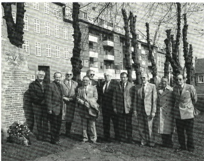
Hannover-Stöcken, årsmødet i Horsens. Den lille forening med den høje mødeprocent.

højtideligheden sluttede vi med at synge »Altid frejdig«.