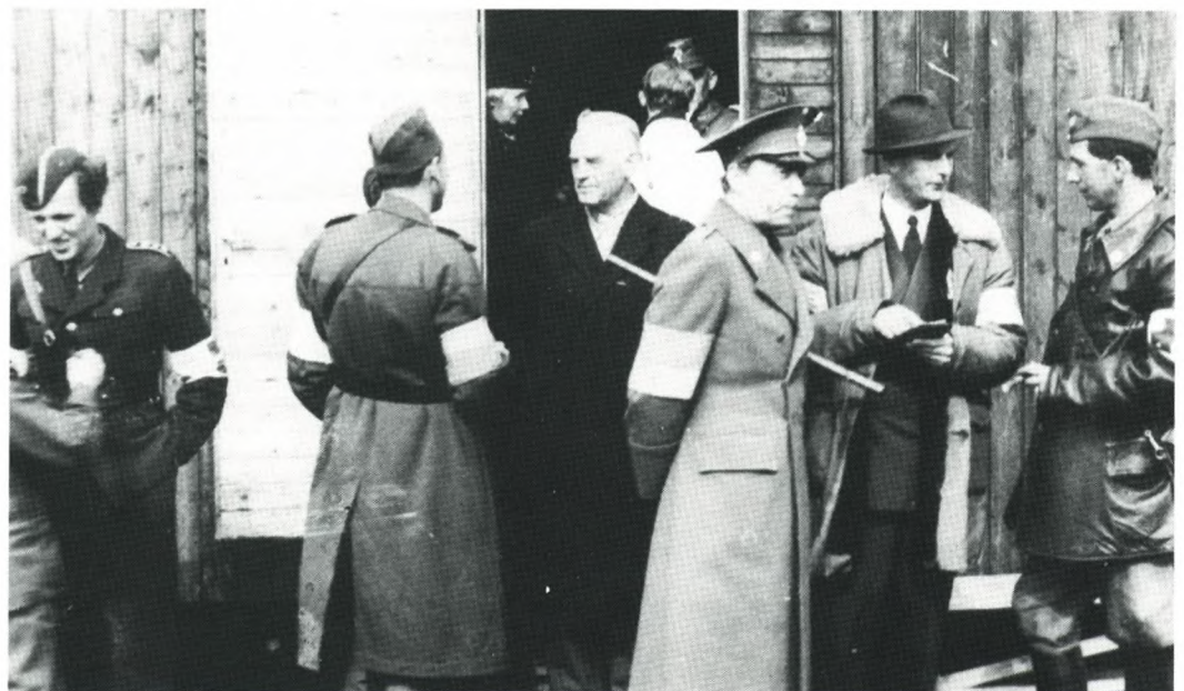
Grev Folke Bernadotte var manden bag hele redningsaktionen med de hvide busser, foråret 45.

De første fangetransporter kom efter store strabadser over grænsen ved Kruså den 8. april 1945. Der var for at undgå epidemier, der fulgte i krigens kølvand, oprettet »karantænestationer« i Kruså og Padborg. Her skulle de udsultede kz-fanger få den første menneskelige behandling i lange tider, og ud over venlighed bestod den i aflusning, bad, et måltid mad og for de flestes vedkommende en nats hvile inden den videre transport til Sverige, idet Danmark stadig var besat af tyskerne. Også de værste sygdomstilfælde blev nødtørftigt behandlet, ligesom der ved Padborg Station blev etable-