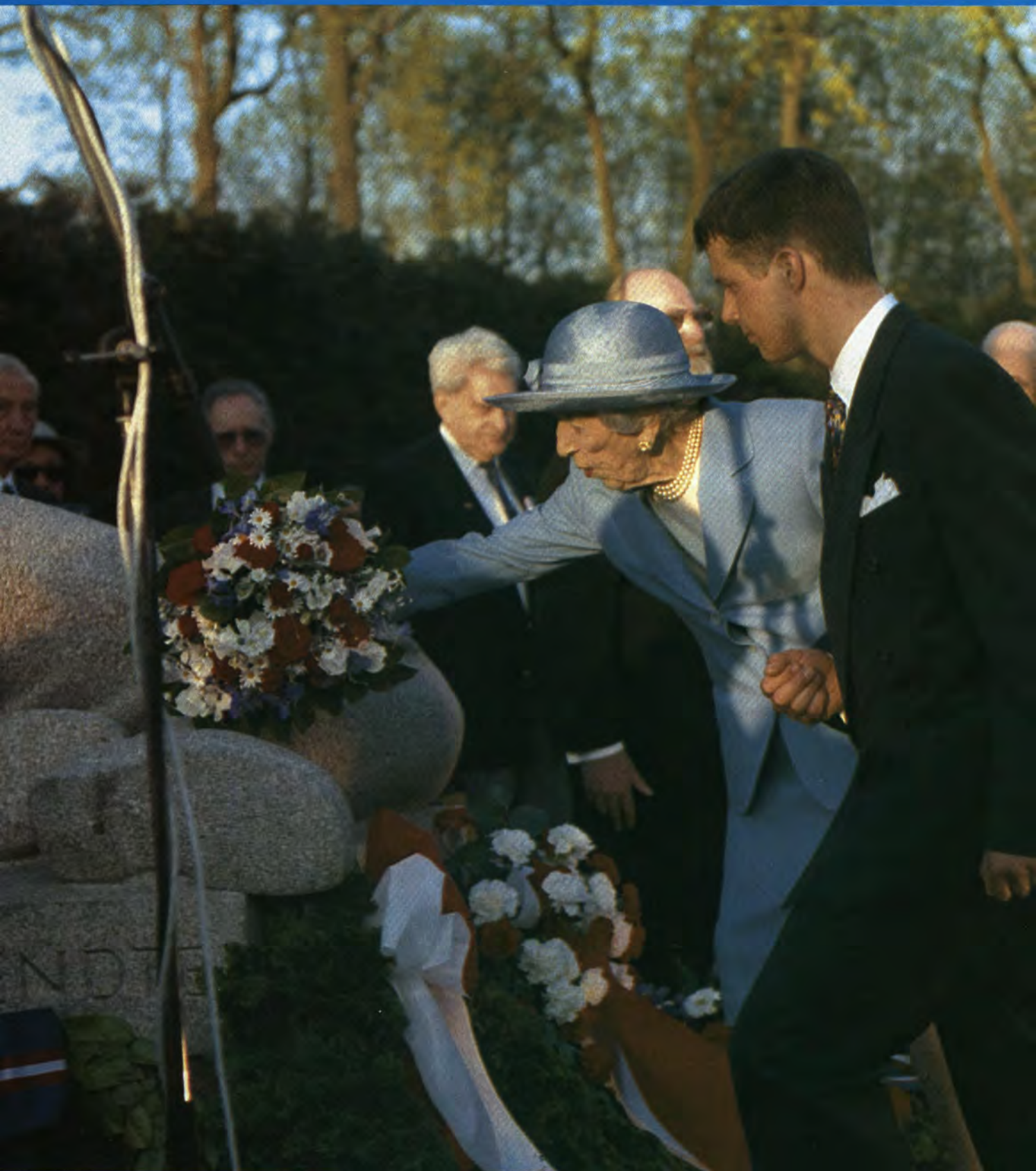
Dronning Ingrid lægger blomster på monumentet i Mindelunden i Ryvangen den 4. maj om aftenen, bistået af sit barnebarn Kronprisen.