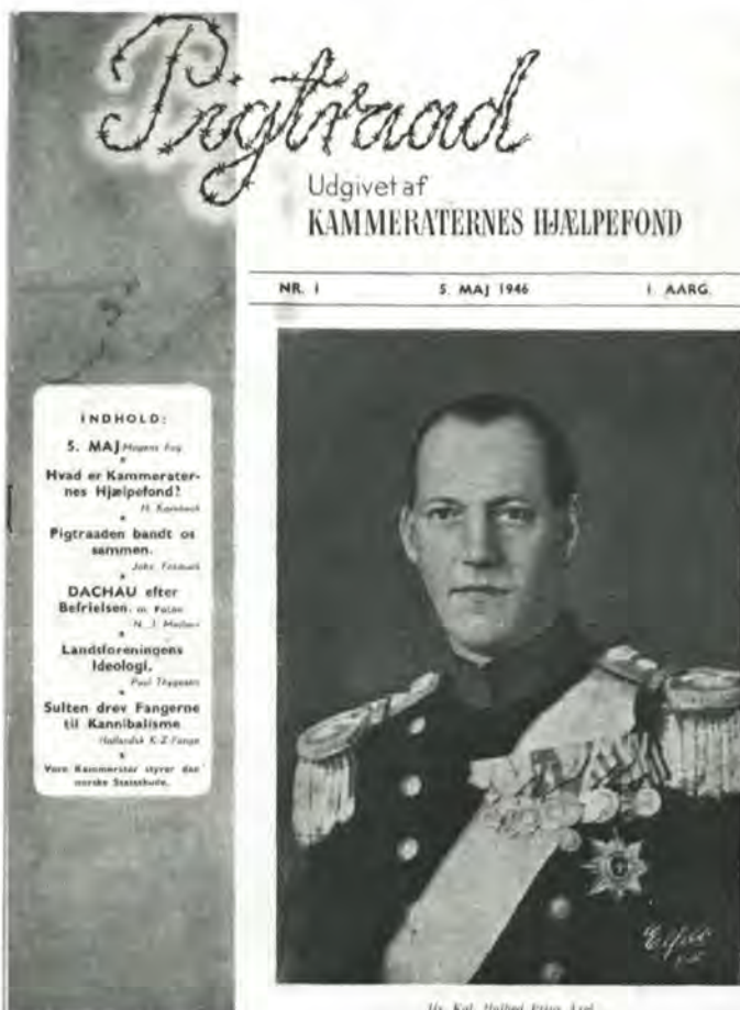
Forsiden af PIGTRAADs første nummer bragte et billede af Hans Kgl. Højhed Prins Axel, der allerede på det tidspunkt havde sagt ja til at være protektor for Kammeraternes Hjælpefond.

I en artikel i bladet redegør Fangesammenslutningens ny-