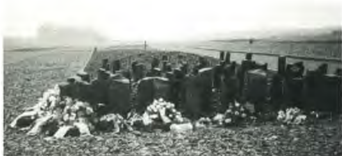
Tågen hang over Buchenwald, da monumentet over sigøjnerne, der døde i Buchenwald, var indviet ved en højtidelighed på appelpladsen lørdag den 8. april. I baggrunden skimter man igennem tågen den store bygning med Effektenkammer, der nu rummer museet.

se nedlagt, dels af mange landes diplomatiske repræsentanter, dels af repræsentanter for de forskellige landes fangeforeninger