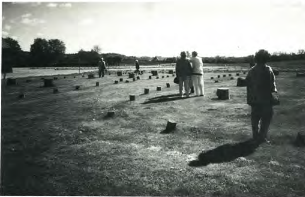
Et stort bysamfund fra omkring Kristi fødsel er ved at blive udgravet i og omkring Gudme. Kammeraternes Hjælpefonds bestyrelse og deres gæster hørte foredrag derom og fik lejlighed til at besøge stederne. På billedet ses to store bygningers omrids afmærket. Den største afbygningerne har været over 50 m lang.

Udstillingen er åben til den 31. oktober.