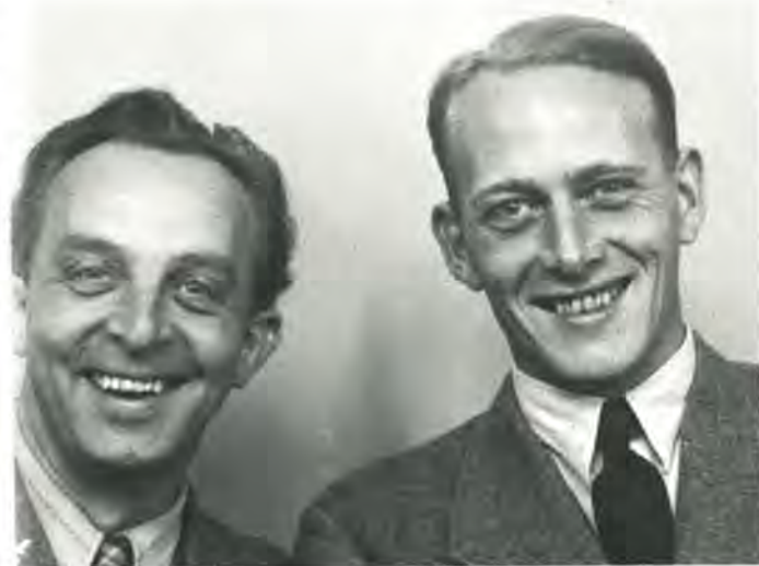
To politifolk, hvis navne m.v. efterlyses.

Hjemmeværnet i Klampenborg er et ægte barn af modstandsbevægelsen. Kompagniet kan datere sine rødder tilbage til 1944, hvor det startede som en modstandsgruppe. Efter krigen blev det til en Hjemmeværnsforening, og ved oprettelsen af det statslige Hjemmeværn i 1949 fik kompagniet sin nuværende betegnelse.