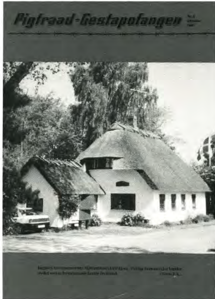
Forside af PIGTRAAD/GESTAPOFANGEN. Billedet er et foto af huset på Kegnæs.