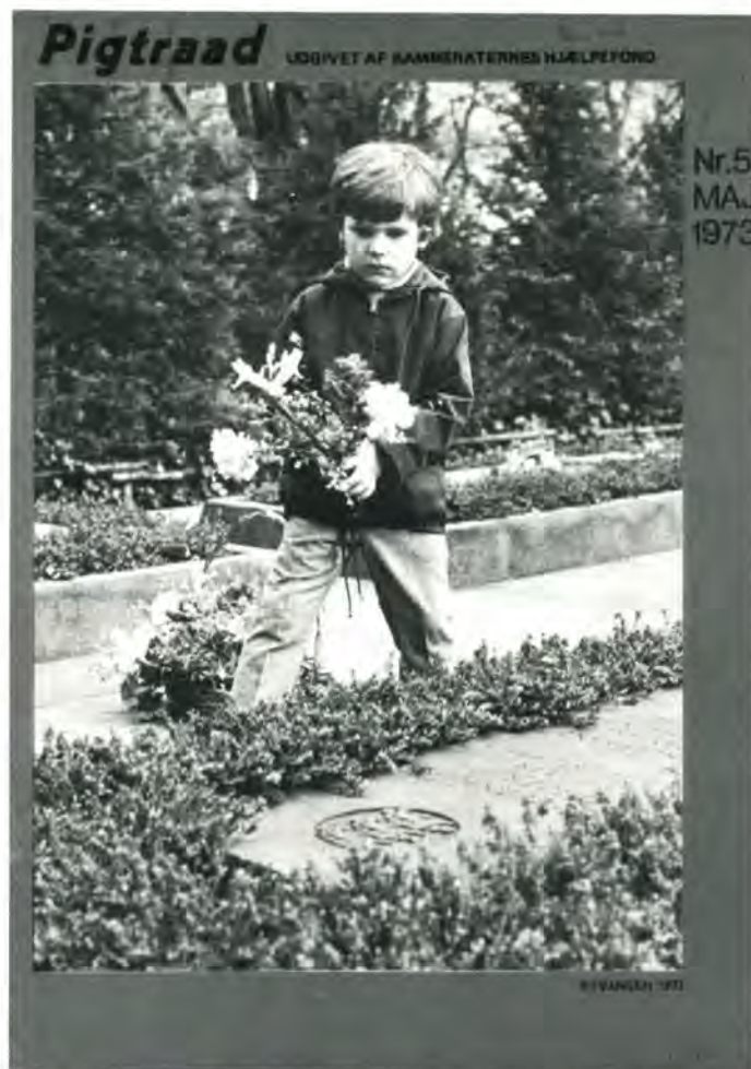
Karakteristisk forside på bladet. Billedet er fra Mindelunden i Ryvangen.

Bestemmelsen om, at landsforeningens medlemmer får bladet PIGTRAAD tilsendt gratis, falder naturligvis bort med landsforeningens opløsning. PIGTRAAD meddeler derfor, at de medlemmer af Landsforeningen, der ønsker at modtage bladet, nu må indmelde sig i Kammeraternes Hjælpefond. Her er det årlige medlemskontingent 10 kr. Når det kan lade sig gøre at sende bladet PIGTRAAD gratis til alle Kammeraternes Hjælpefonds medlemmer, skyldes det, at bladet på