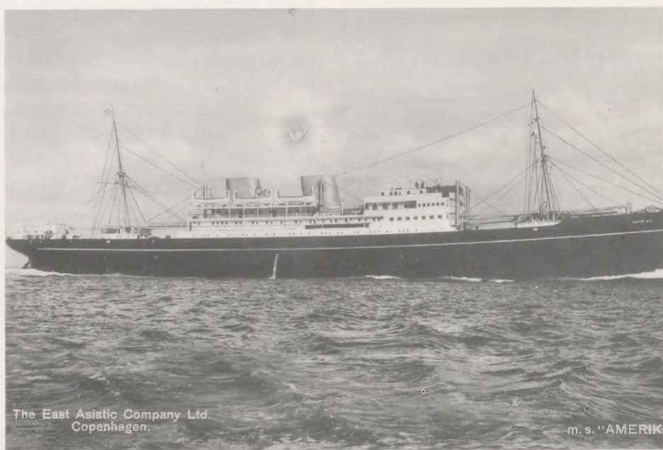
ØKs M/S Amerika der blev torpederet i nordatlanten den 21. april 1943 med et tab på 5 kvinder og 86 mand.

Hvis du ikke engang imellem laver noget skidt, laver du for lidt.