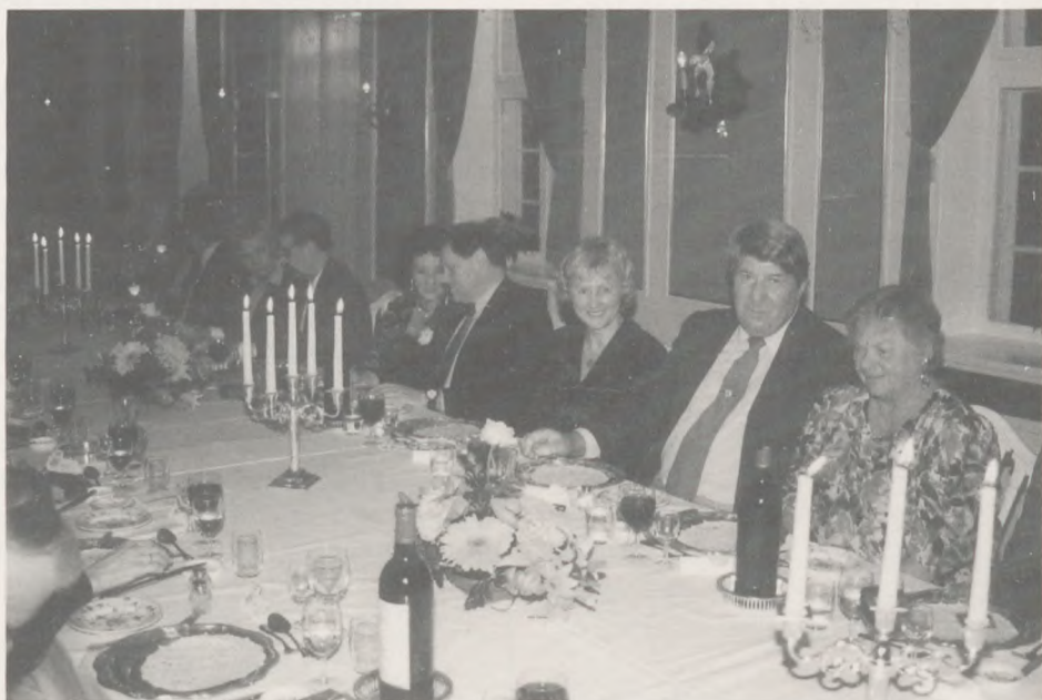
De smukt dækkede borde og en del af de glade gæster, som deltog i stiftelsesfesten.