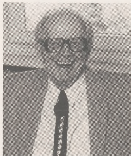
Som Jejse ser ud idag, frisk og glad for livet.