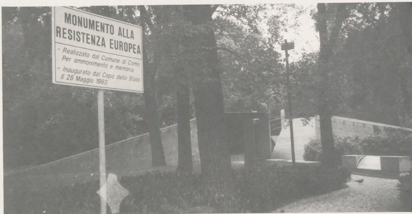
Også uden for Danmark mindes danske modstandsfolk.