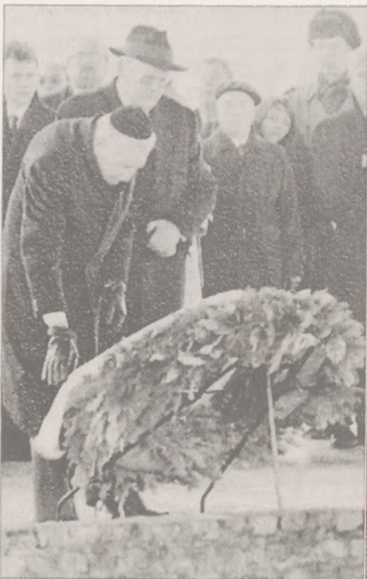
Israels præsident Ezer Weizman lægger en krans i kz-lejren i Sachsenhausen, hvor over 100.000 mennesker blev myrdet under 2. Verdenskrig.

Den israelske præsident flyver i dag til Bonn, hvor han skal have forhandlinger med forbundskansler Helmut Kohl og udenrigsminister Klaus Kinkel. (RB)