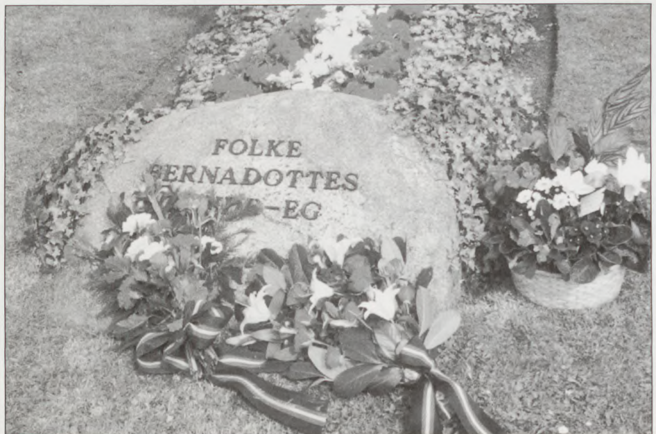
Folke Bernadottes minde-eg plantet den 5. maj 1970 Bernadottegården Roskilde.

Denne fremgangsmåde har hidtil ikke givet de store problemer. Der var ingen større ventetid på en bolig. I de senere år er flere og flere nået op