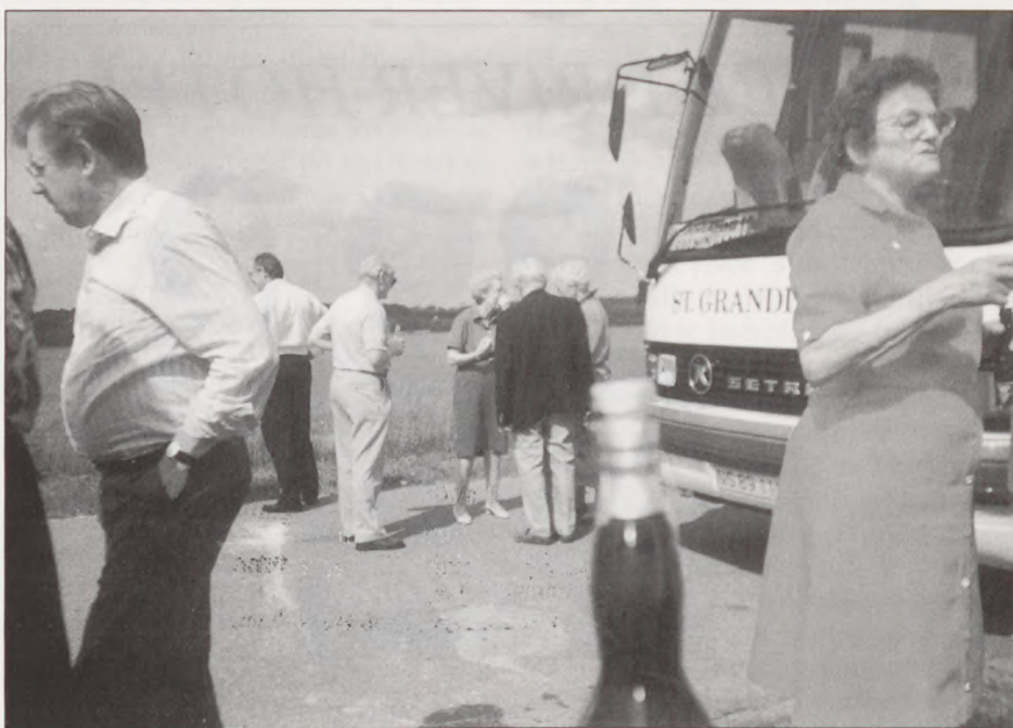
Her et udsnit af deltagerne i Neuengammeforeningens 35 års fest, »kigger« ud over Tystrup-Bavelse sø.