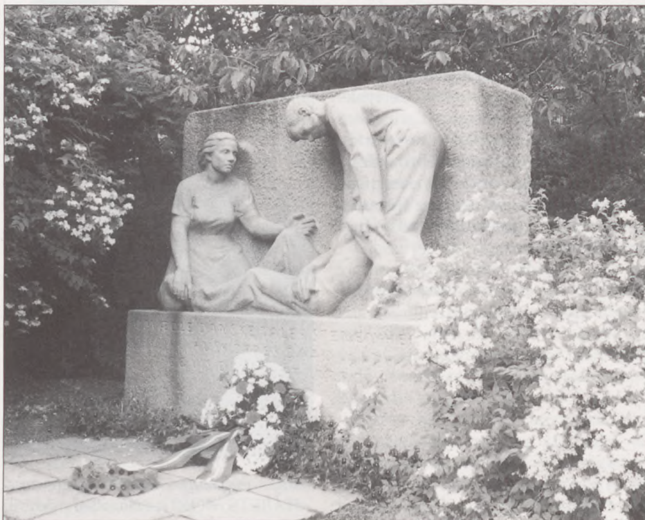
Frihedsmonumentet ved Slotssøen i Kolding. Landsforeningen af Gestapofanger har nedlagt den smukke krans.