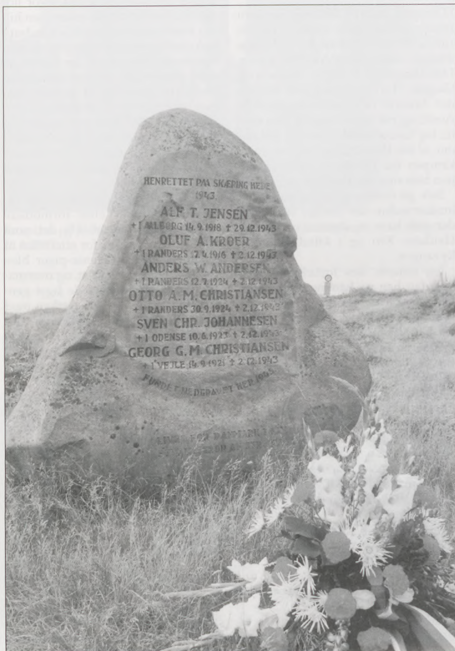
Mindestenen ved Husbjerg.