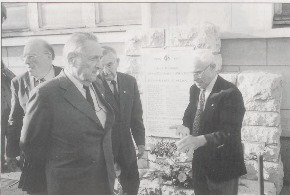
Kransenedlæggelse for myrdede modstandsfolk og deporterede. Angers banegård 19.9.1997.