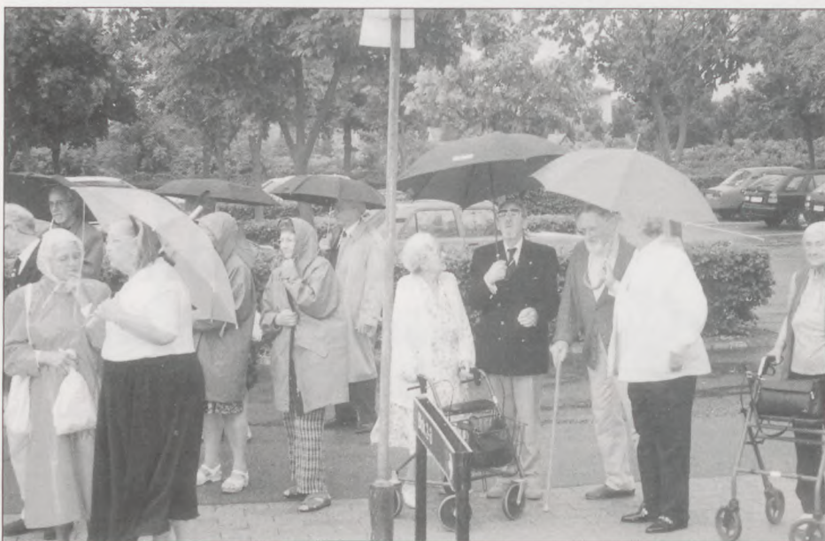
»Paraplyparaden« ved Mindeegen inden vi fortrak til »Det skæve hjørne«