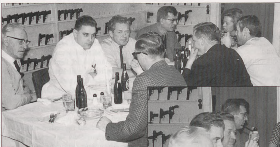
Frokost i våbendepotet, teknisk afd. Politigården, på den tid artiklen omtaler.

Oskar Lilja, Pens. Pa. Forkortet af redaktionen.