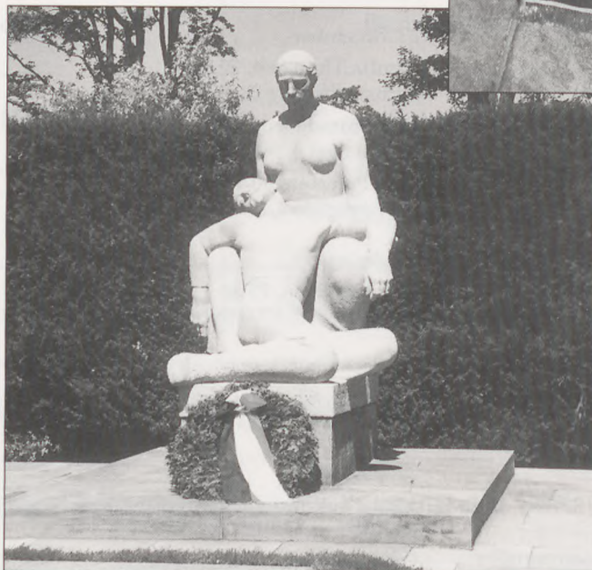
Monumentet i Mindelunden med USAs krans, nedlagt af præsident Clinton

»The People of the United States of America« Teksten på kransen taler for sig selv.