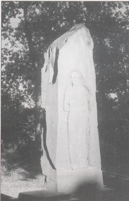
Monument over de henrettede i Belle Beille 21.9.1997.