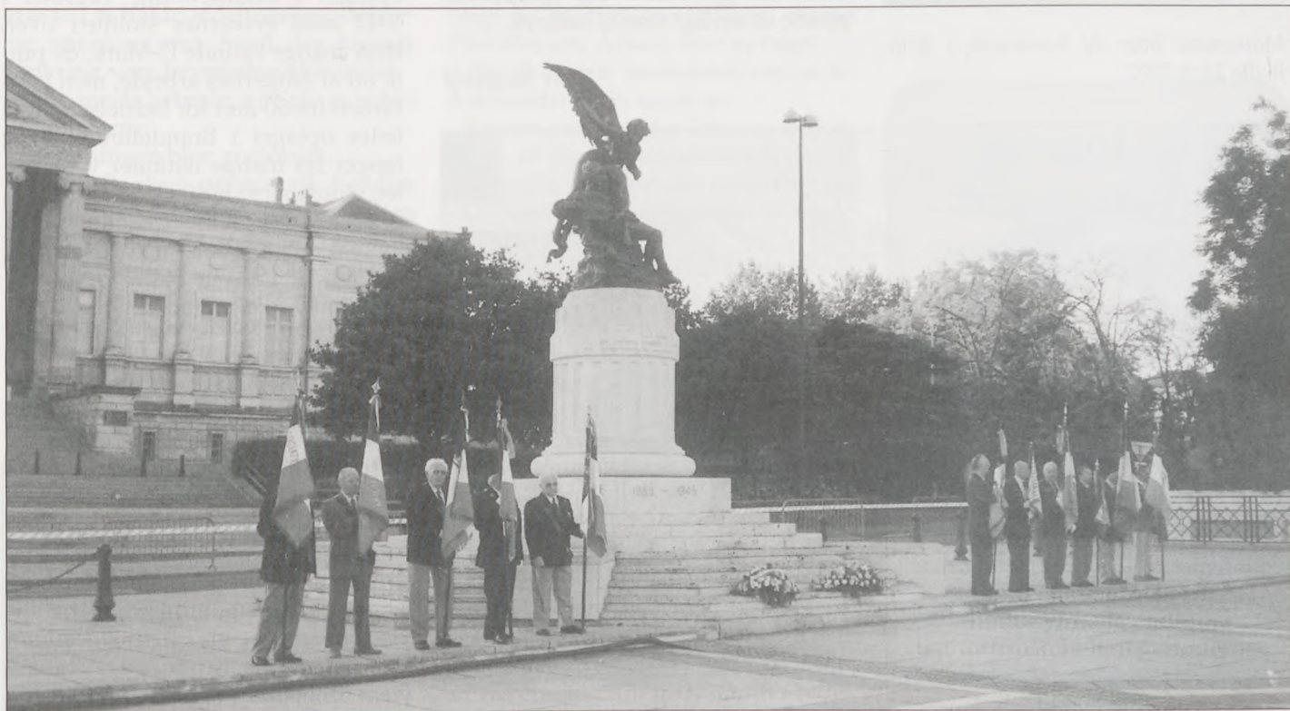
Kransenedlæggelse for krigens døde ved monumentet foran rådhuset i Angers 21.9.1997.