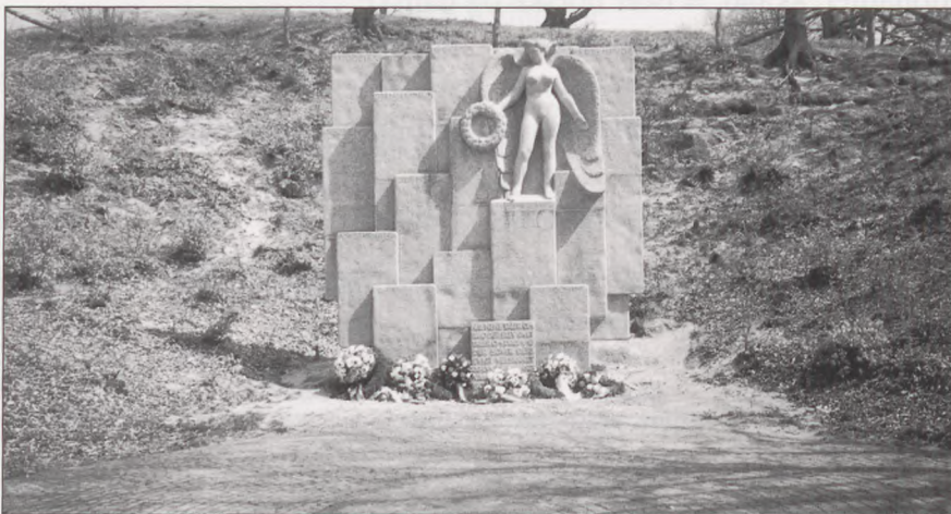
Det smukke monument på Frøbjerg Baunehøj