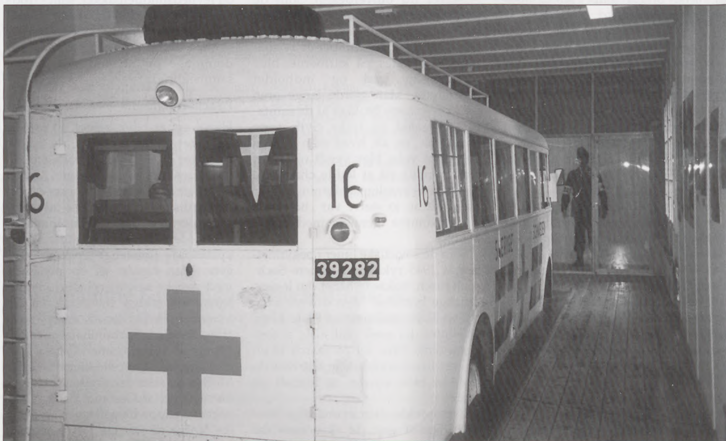
En af de Hvide Busser er nu kommet på museum. Indsatsen vil dog aldrig blive glemt.

En sidste, fjerde fase omfattede et stort antal ikke-skandinaviske fanger fra kvinde-koncentrationslejren Ravensbrück og begyndte i slutningen af april. Her blev der brugt både danske og svenske busser samt en lastbilkolonne fra det Internationale