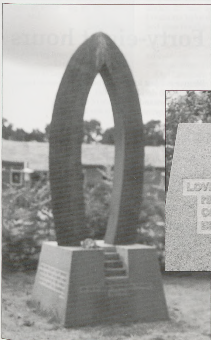
Håbets Port ved Horserødleiren.