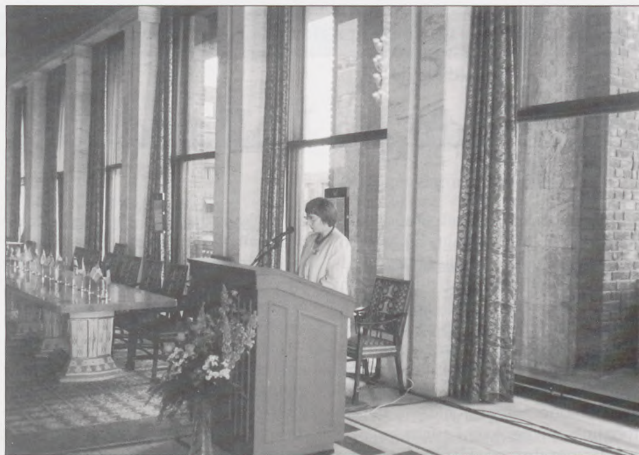
Plenarmødet ISK i Oslo den 16. maj 98. Borgmesteren byder velkommen på Oslo Rådhus.