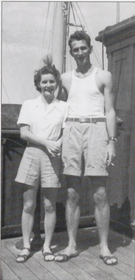
Krigen er slut. På vej hjem, sammen med min tilkommende kone. Fotoet er taget på Stillehavet.

bare mineral. Jeg mønstrede så af, da vi kom til New York efter 3 rejser til Grønland, påmønstrede så atter »Gertrud Torm«, som i mellemtiden var kommet under Panamaflag, og nu hed Vagrant, hvilket direkte oversat til dansk betyder omflakkende bums. Jeg synes det var synd at give hende sådan et navn, men det har jo nok ikke været let at finde på navne til alle de udenlandske skibe, der efterhånden kom under dette flag. Vi sejlede til Cuba, hvor vi lastede sukker til New Orleans og derfra stykgods til Panama og Chile.