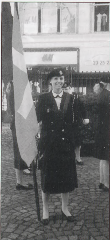
Kvindelige Mariners musikkorps fanebærere

Traditionen tro afholdt Neuengammeforeningen d. 20. april sit årlige mindesmøde ved søjlen ved flammen for den ukendte k-z fange, ved Helligånds kirken.