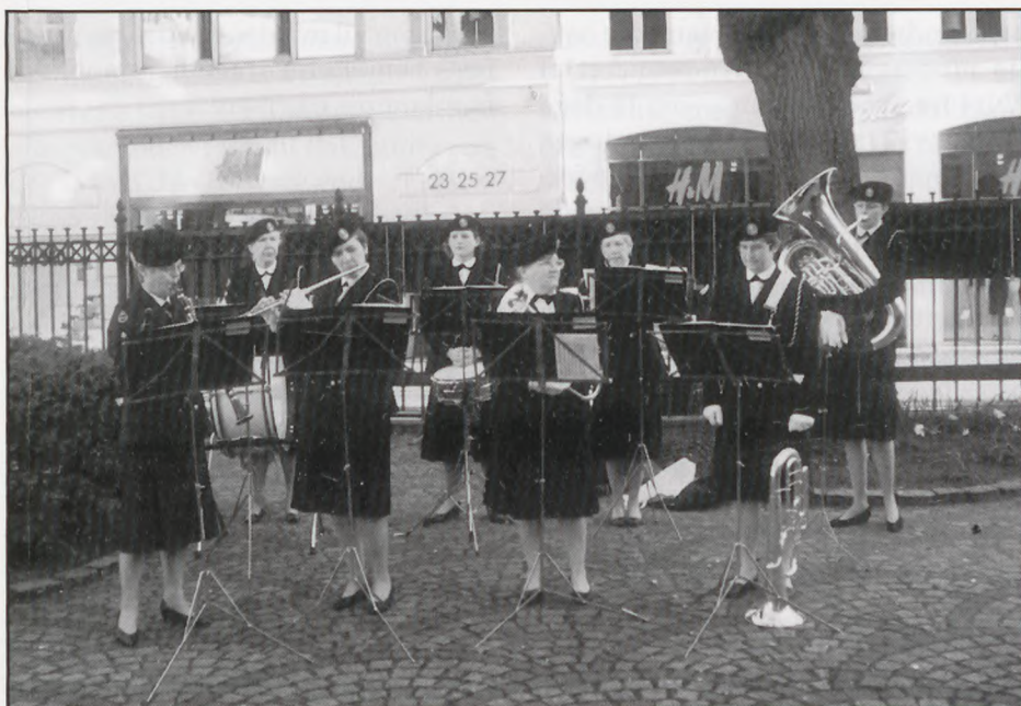
Kvindelige Marines musikkorps

de var fuldstændig enige om, at Tyskerne skulle ud af landet og så kunne vi - som et folk - igen diskutere, ja mundhugges om dette og hint. Demokratiet med ytringsfriheden skulle tilbage til Danmark, og det kom den, også det var den ukendte kz -fange med til.