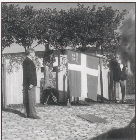
Neuengammefoeningens krans ved mindesmærket Finkerwerde efteråret 1997

Neuengamme udekommandoen Deutsche Werft, Finkenwerde, Hamburg