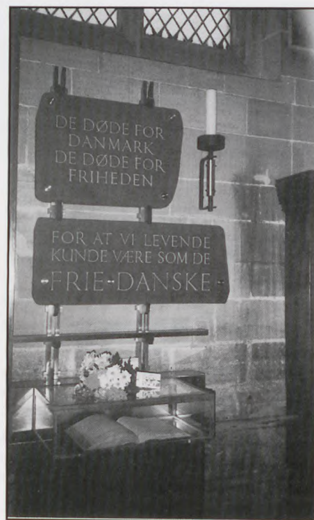
Mindestedet i Sct. Nicholas Cathedral med bogen, hvor de døde og savnedes navne befinder sig.