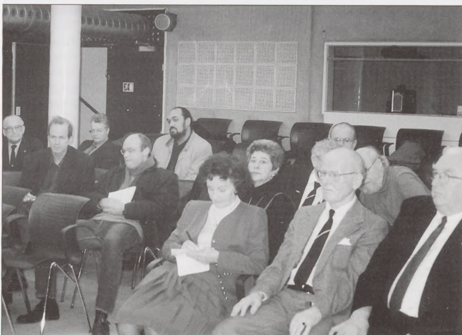
En del gamle KZ fanger og journalister og pressefotografer.

Usikkerhed er der ligeledes om, hvem der foruden slavearbejderne