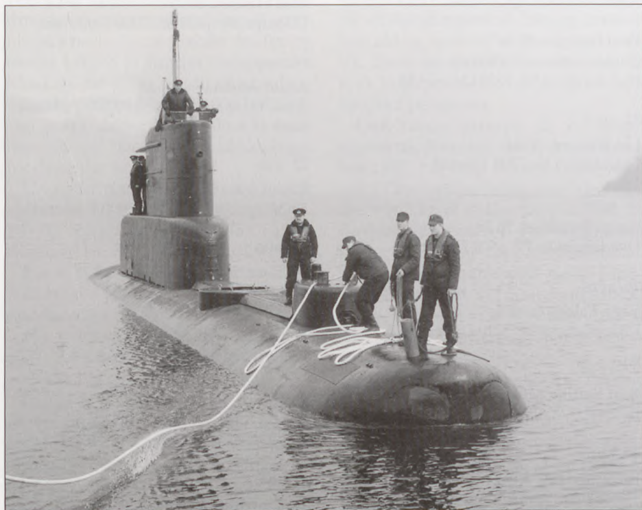
En af flådens nutidige u-både, Nordkaperen, er ved at gå til kaj i Mariager havn.