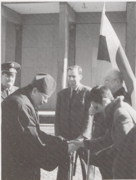
Berlins ortodokse biskop hilser på et barnebarn.