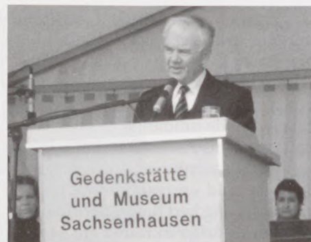
Ministerpræsident Manfred Stolpe taler på 55-året for Sachsenhausen lejrens befrielse.