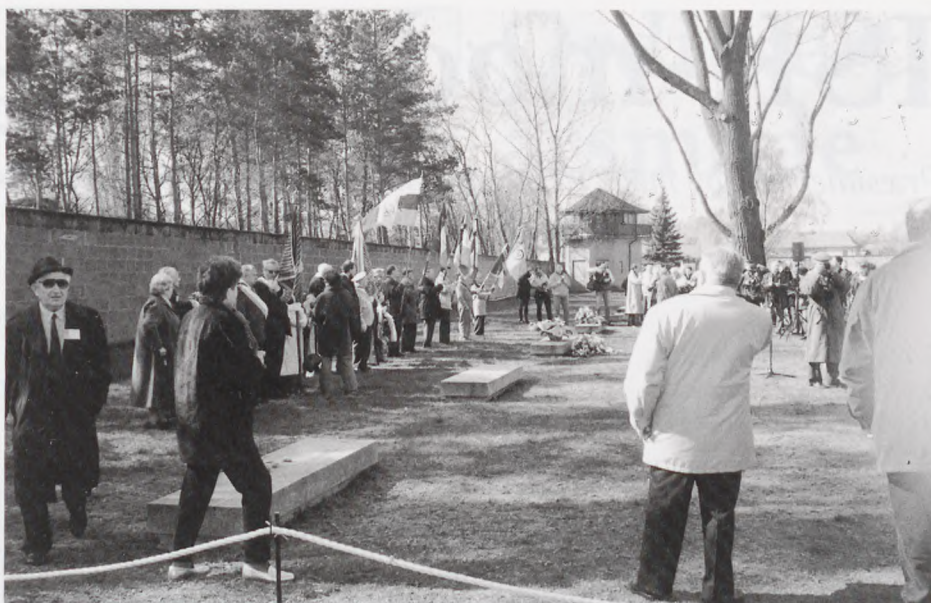
Højtidelighed ved gravene bag revieret.

Derefter gik vi til Station Z, hvor højtidelighederne blev indledt med velkomst ved Werner Händler, taler af Charles Desirat, af ministerpræsident Manfred Stolpe, senator for