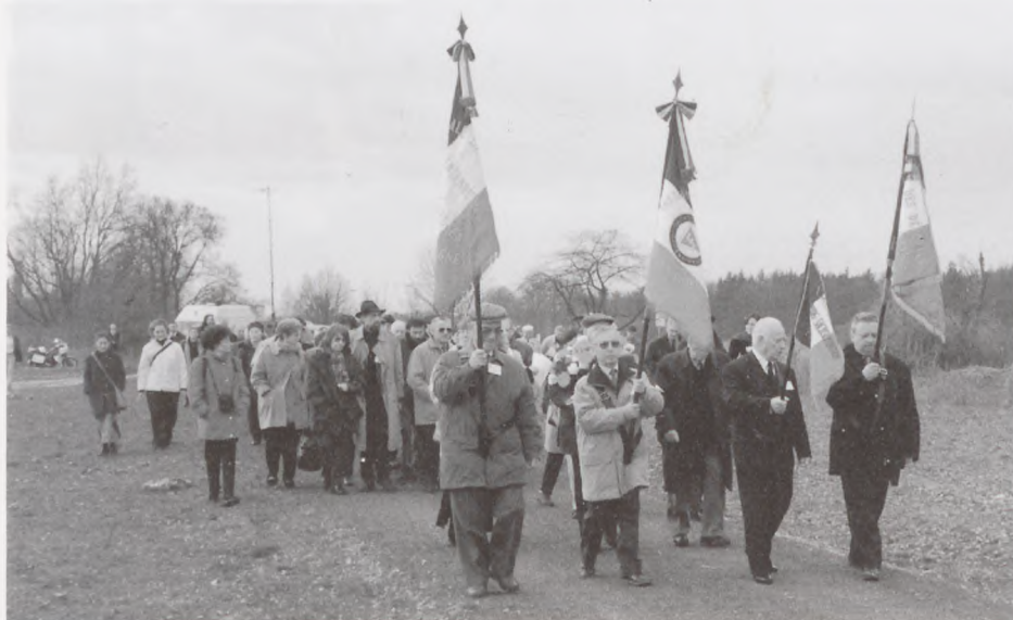
Deltagere på vej til højtideligheden med den franske faneborg i front: Foto: Peder Søegård.

Præsidiemøde og møde til minde om befrielsen i 1945 i Sachsenhausen, april 2000