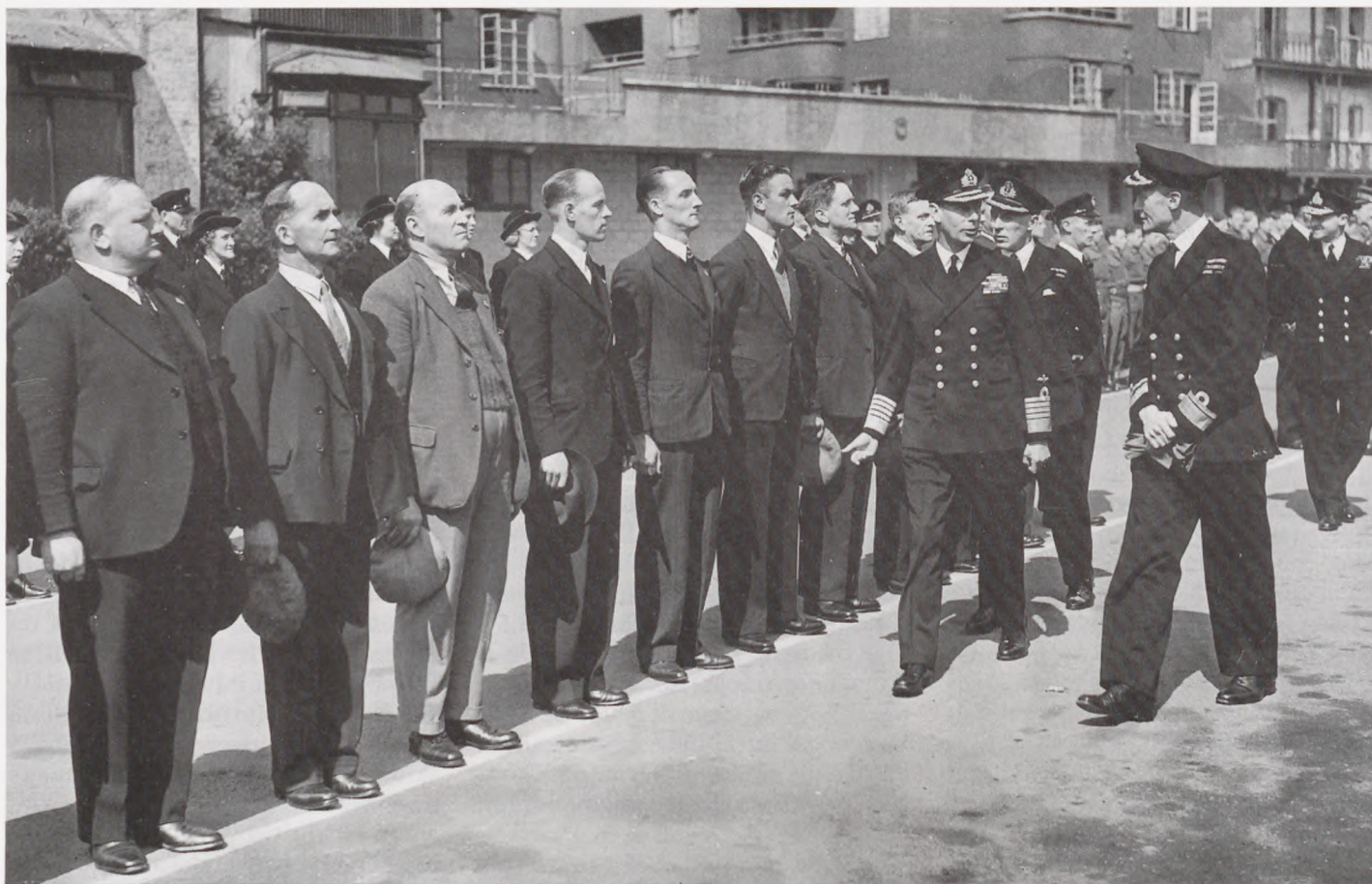
Den britiske konge besøgte regelmæssigt – og hilste på – Mercant Navys mandskab. Vi ser, at der er uuniformerede personer på billeder. Det var jo handelsflåden, sømænd fra allierede lande sejlede i.

nåede at flygte fra Vichy – franske havne og komme til Newcastle.