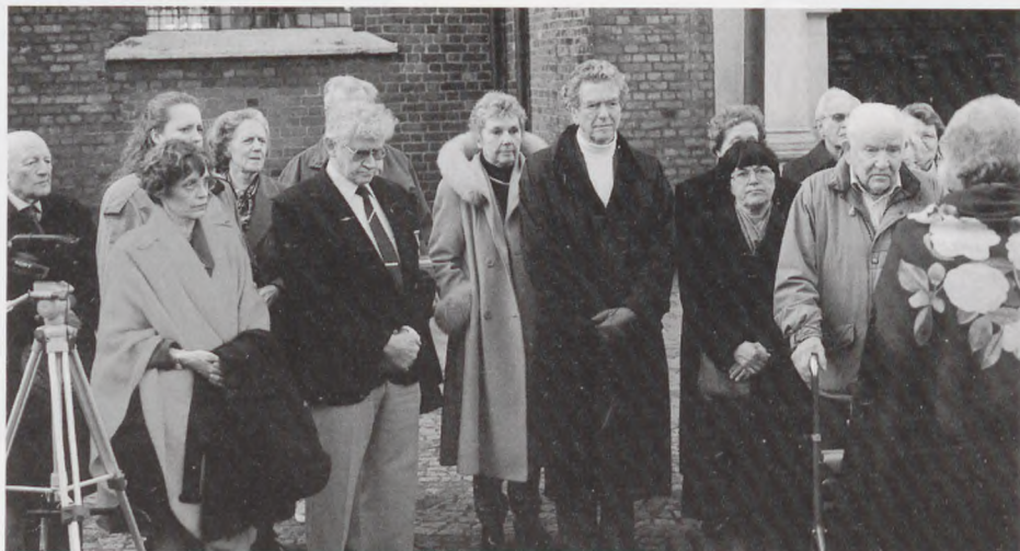
En del af de mere end 50 tilhørere lytter bevæget til talen.