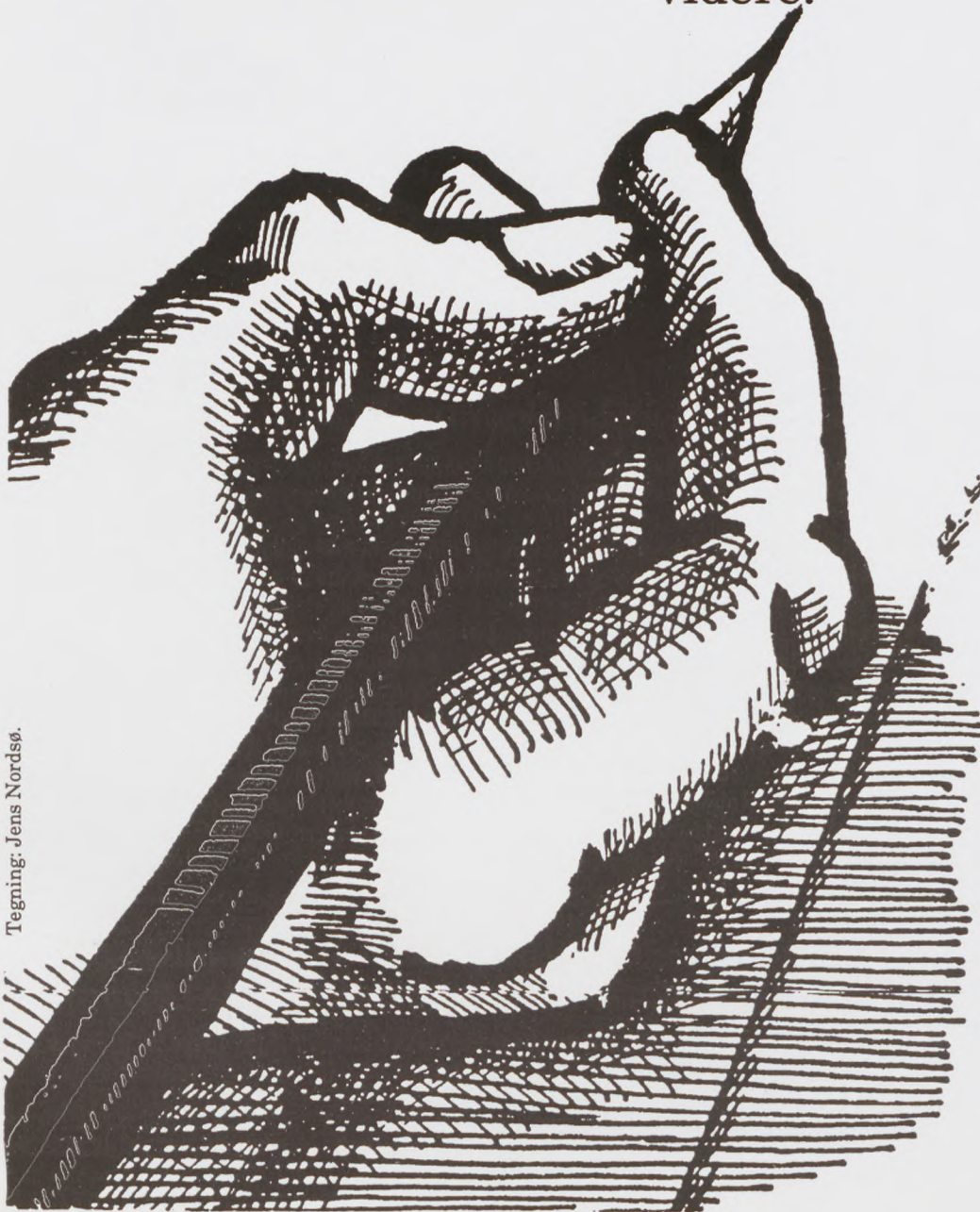
Tegning: Jens Nordstø.