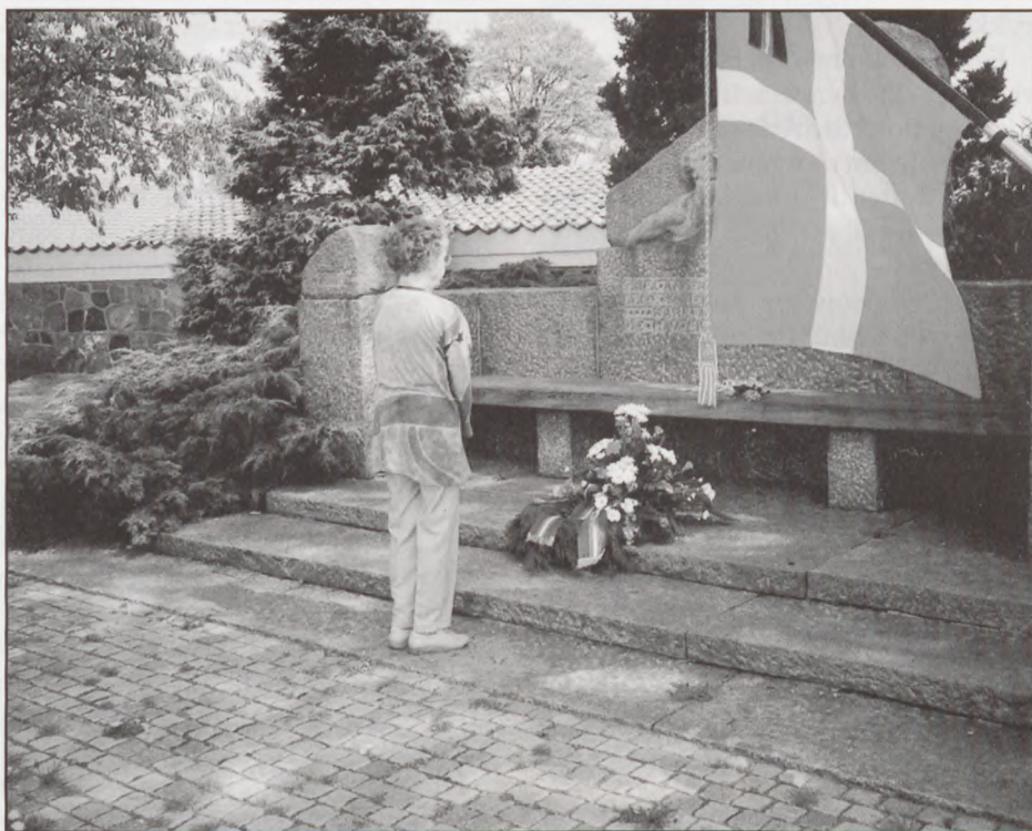
Pia Bastrup Frandsen lagde kransen ved monumentet i Hornslet over de henrettede fra Hornslet-gruppen.