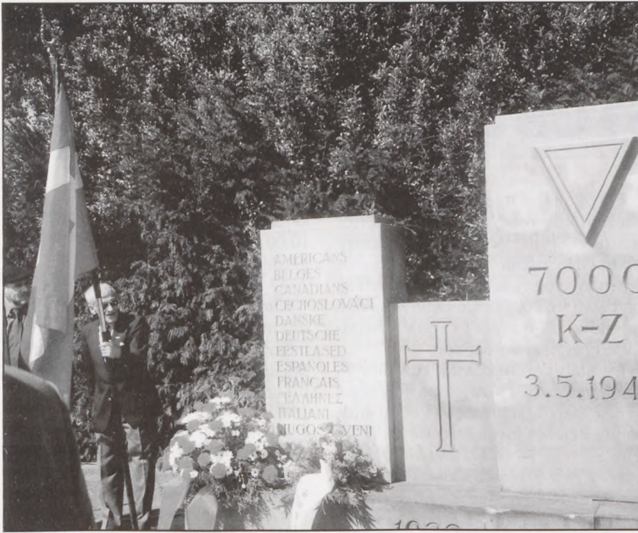
AIN's krans ved monumentet i Neustadt-Pelzerhagen.

der ønsker at glemme fortiden, så beskæmmende den er for vores land, og