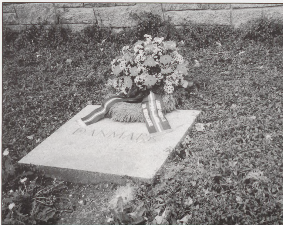
Neuengammeforeningens krans ved Danmarksstenen i Neuengamme.