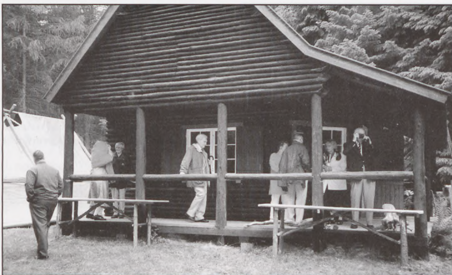
Jagthytten ved Gjorslev Slot spillede en vigtig rolle ved de illegale transporter til Sverige under besættelsen.