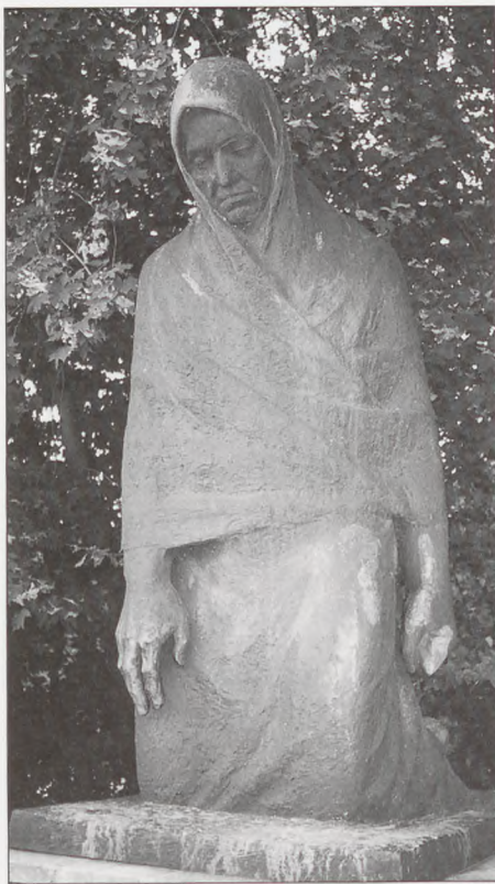
Det meget manende monument i Schwerrin.

mik. På stedet var der en gammel-dags stenovn til at bage brød i. Ovnene var blevet varmet op med brænde flere timer før vi kom. Så blev ovnen rensed, og nu kunne der bages ved de varme sten.