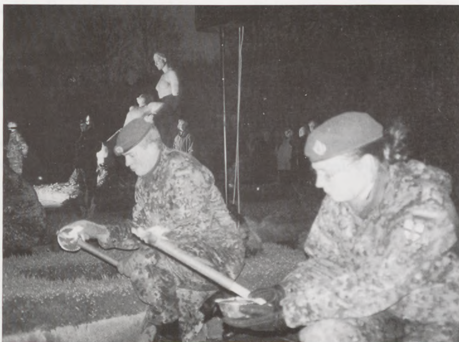
Hjemmeværnet tænder de levende lys inden højtideligheden.

storiske kilder. De første tre år har efterladt kilder, men de var underkastet selvcensur, man skulle være forsigtig for ikke at påkalde tyskernes vrede og