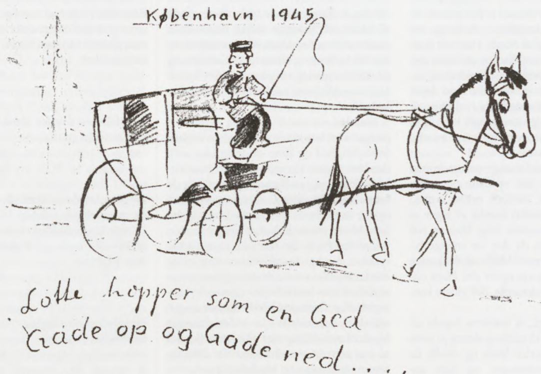
Israel Alfred Gluck, Horse-drawn Carriage, Buchenwald, 1945, pencil on paper.