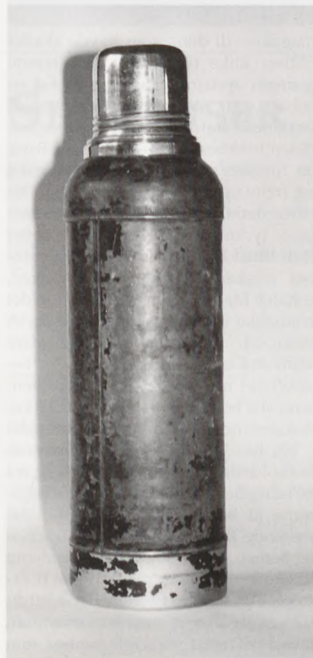
En termoflaske af dette materiale er uforgæn- gelig