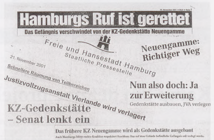
Aviserne fulgte forhandlingerne op. Medierne viste retsind.