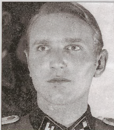
Søren Kam som 22-årig, da han kæmpede for tyskerne ved østfronten.

Danmark udstedte så sent som i 1999 en international efterlysning. Den opretholdes fortsat. Kam – Danmarks formentlig værste nulevende terrorist – kan derfor kun vide sig sikker i Tyskland.