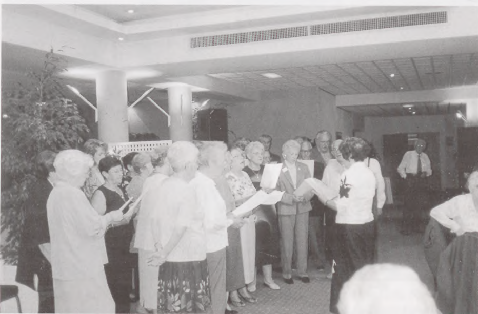
Den franske Sachsenhausen-forenings sangkor ved mindestedet.