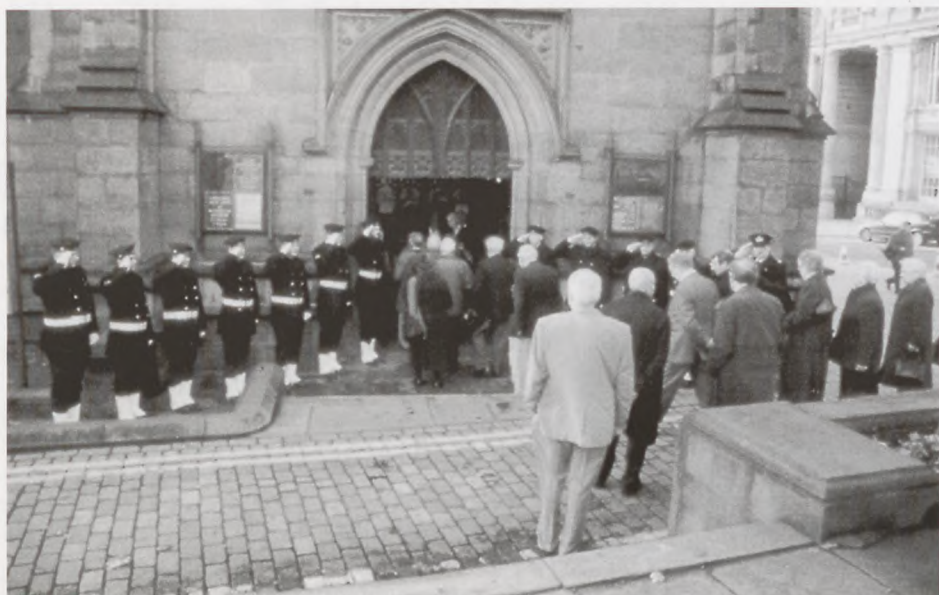
Søværnets æresvagt gør honnør, medens krigssejlerne går ind i kirken.

Invitationer blev sendt til de 234 levende krigssejlere, hvoraf lidt over 100 bor i Danmark. Der var 23 krigssejlere (8 fra Korsør) til stede ved højtideligheden. Flere ville gerne have været med, men var ikke i stand til at rejse på grund af helbredet. Der var 11