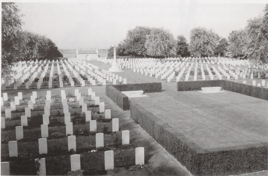
Et vue over en del af den amerikanske kirkegård ved Caen.

ster). Vore internationale organisationer er ved at tabe pusten.