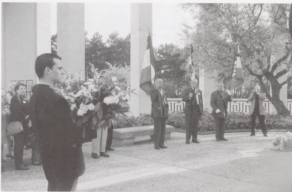
Højtideligheden ved mindestedet i Caen.