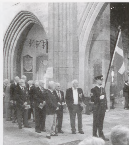
Krigssejlerne følger Dannebrog ind i kirken. Alle andre er i kirken og rejser sig.

For mange af os var Newcastle vor hjemby under de fem forbandede år. Den repræsenterede det eneste frie i Danmark, vi kendte, der var en dansk kirke, der hang et Dannebrog. Der var et kammeratskab, det bedste nogensinde. Det paradoksale er at opleve Newcastle under krigen var ikke særlig opmuntrende, byen var på grund krigen og kulminerne ret beskiddet. I mit første værelse på den »billige ende« af Westmorland Road var der kun gaslys. I dag er det en moderne og meget flot by med høje kul-